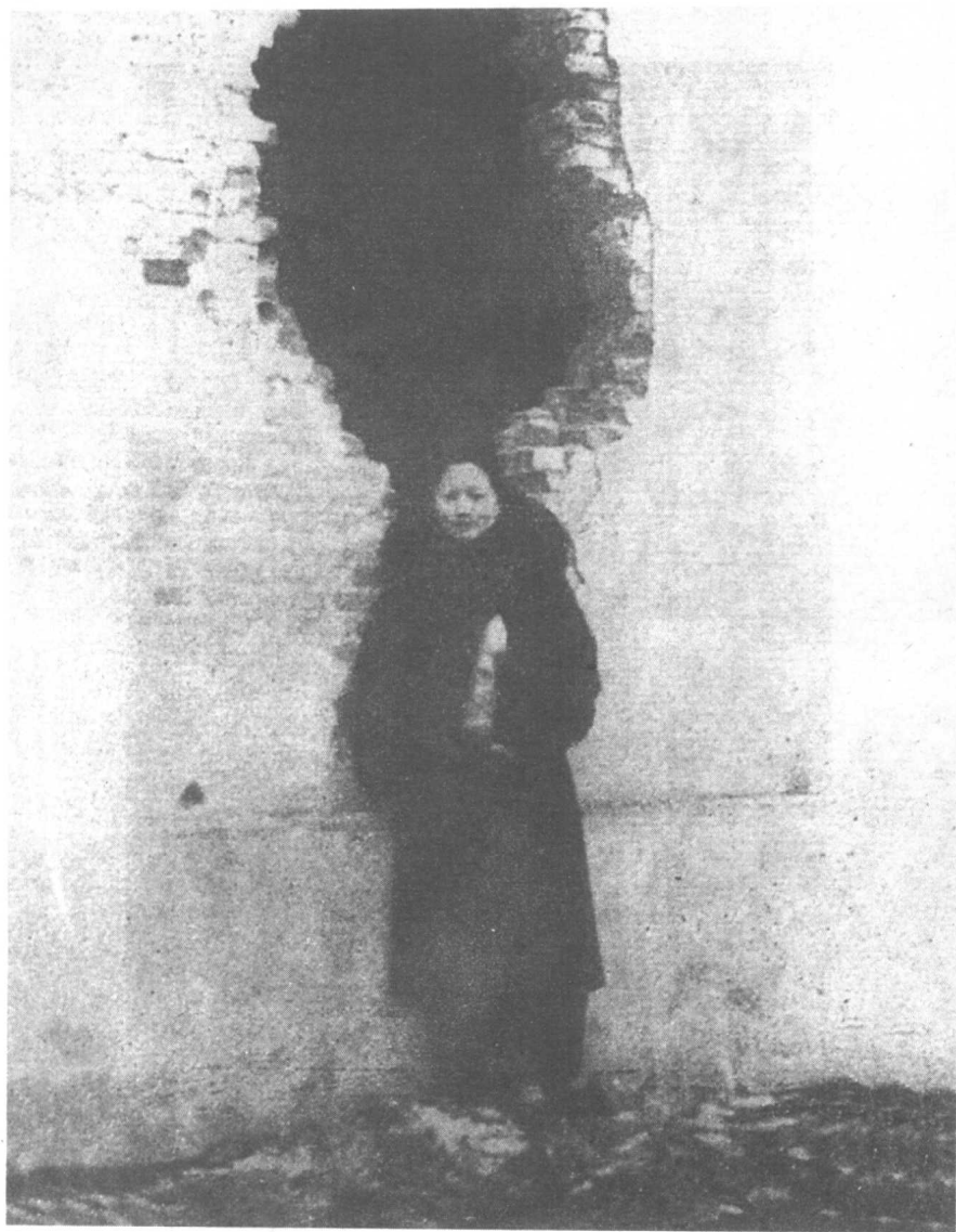
孙夫人宋庆龄手捧拾获的日军炮弹在残墙断壁下留影，以示不忘国耻