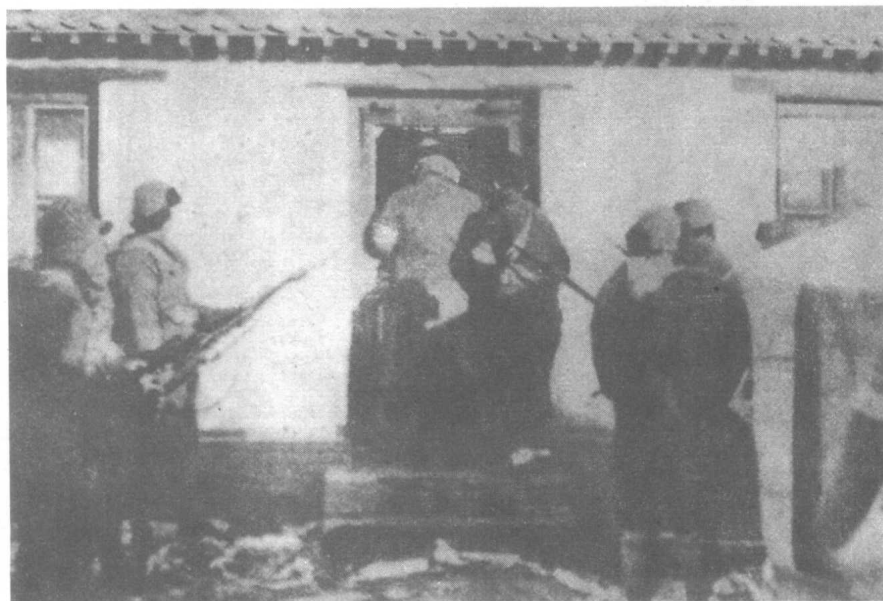
我军搜索百灵庙日本特务机关时的情形