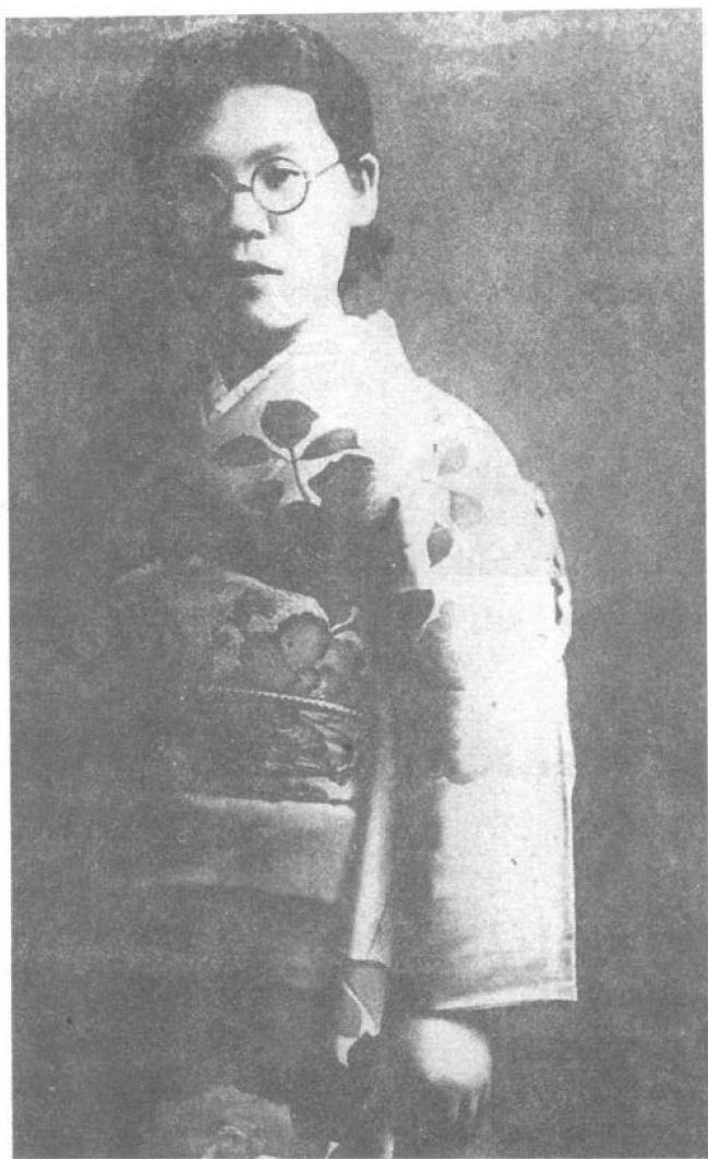
日本反战女作家绿川英子。她在中国用日语向日本军队广播，控诉鬼子兵的兽行