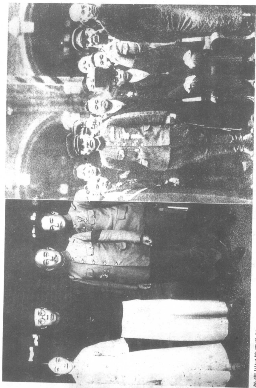
伪满州国傀儡政权