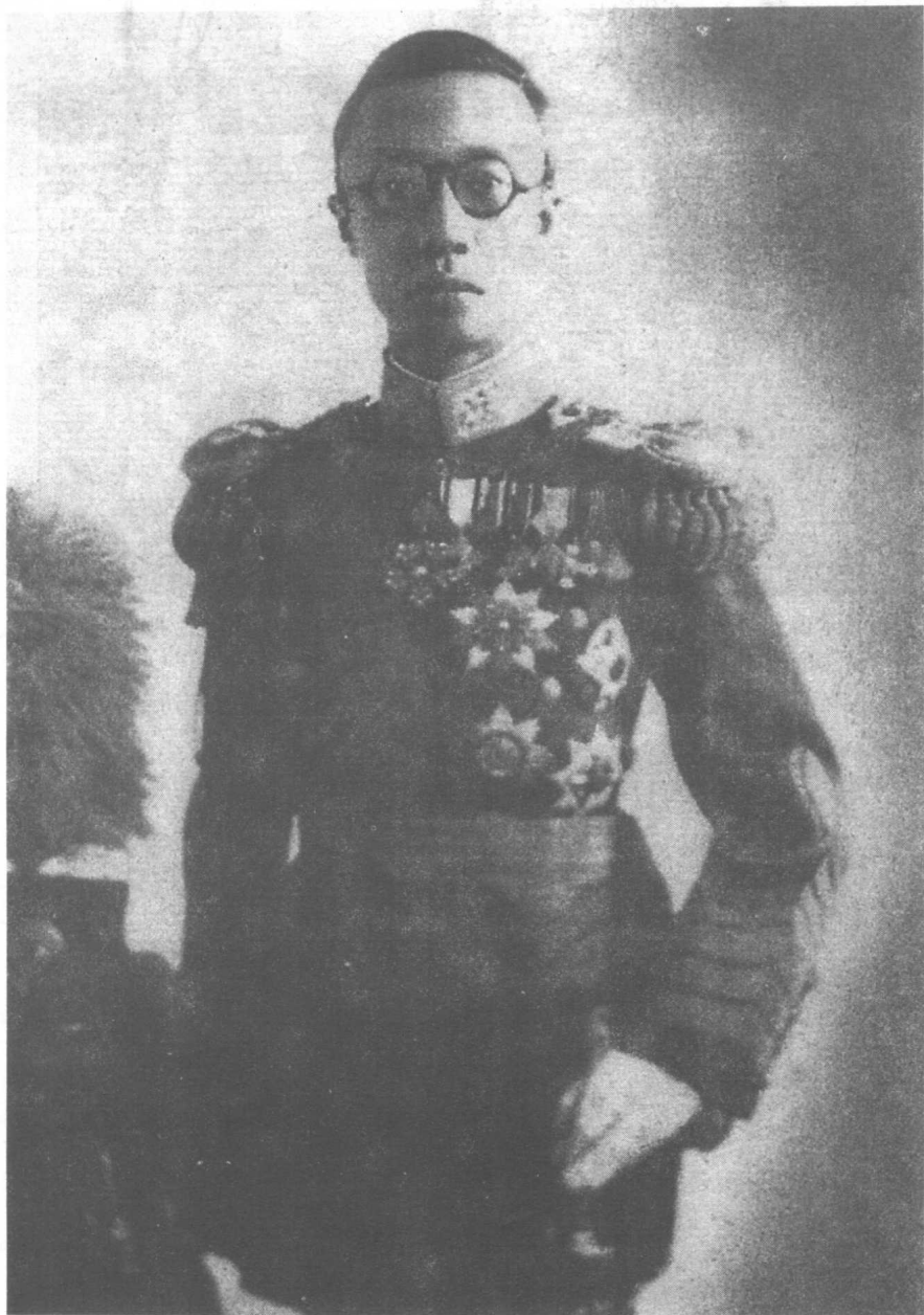
溥仪在日本人的指示下，穿元帅装“登极”，成为伪满“康德皇帝” 这是“登极”后的留影