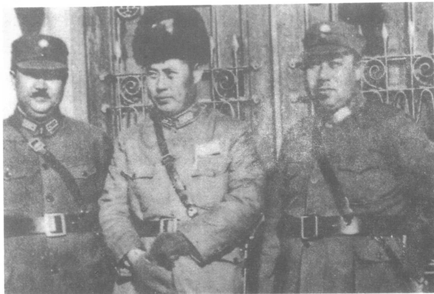
指挥绥远抗战的3位将领。左起：赵承绶、傅作义、王靖国