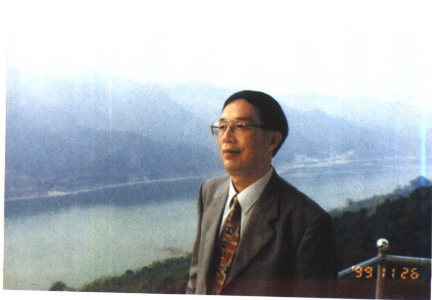
1999年,作者在粤北山区调研