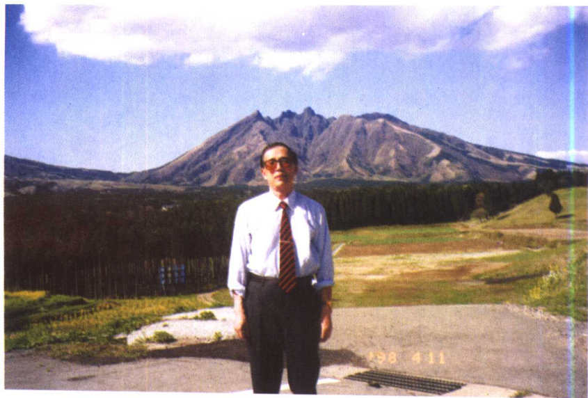
1998年,作者摄于日本熊本县阿苏山