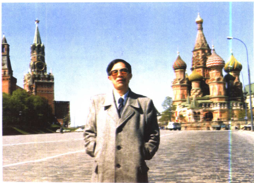
1991年，作者摄于莫斯科红场