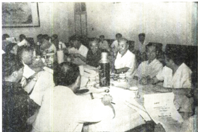
全国好新闻评选委员正开会评定 1981年全国好新闻。