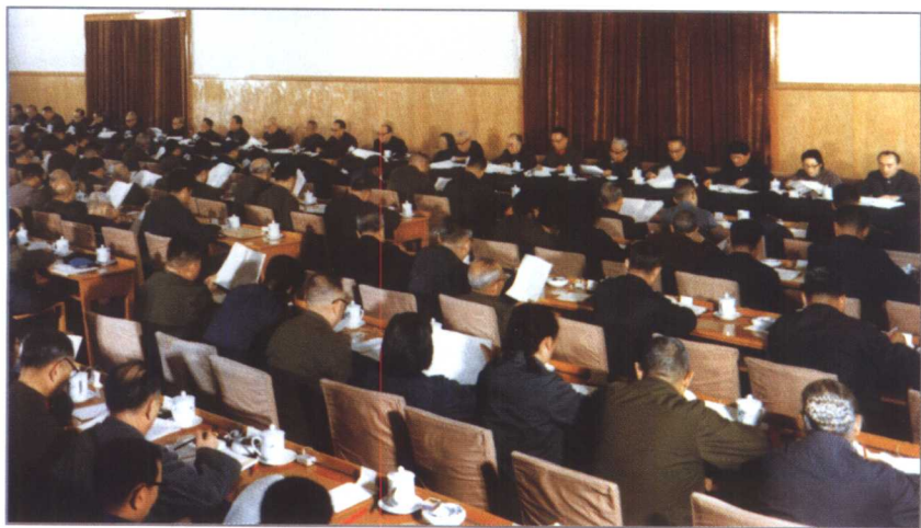
中国共产党第十一届中央委员会第三次全体会议会场。