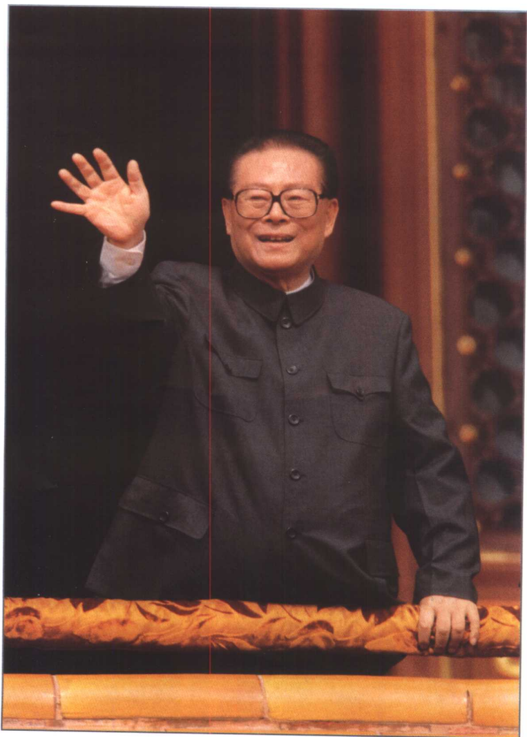
1999年10月1日，江泽民在天安门城楼上向参加庆祝中华人民共和国成立五十周年大会的群众游行队伍挥手致意。