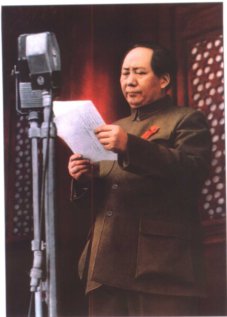
1949年10月1日，毛泽东在天安门城楼上庄严宣告中华人民共和国中央人民政府成立。