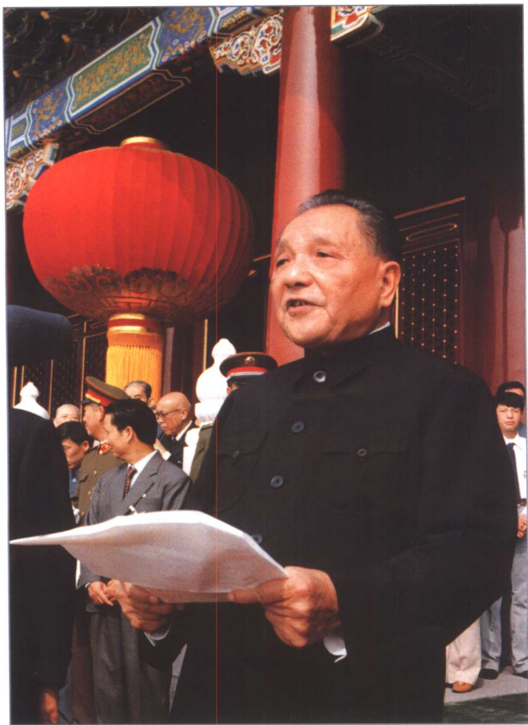
1984年10月1日，邓小平在中华人民共和国成立三十五周年庆祝典礼上发表讲话。