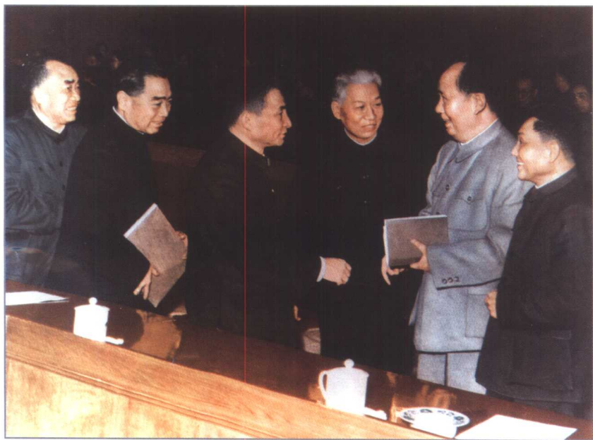
毛泽东、刘少奇、周恩来、朱德、陈云、邓小平在 1962 年初扩大的中央工作会议（七千人大会）上。