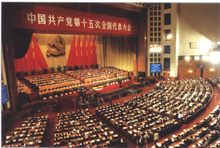
中国共产党第十五次全国代表大会会场。