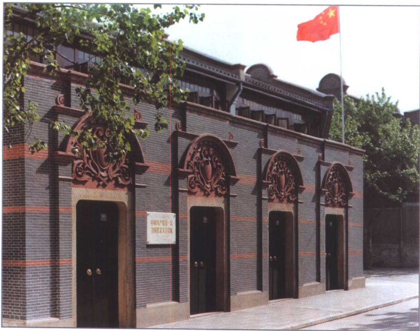
中国共产党第一次全国代表大会会址。