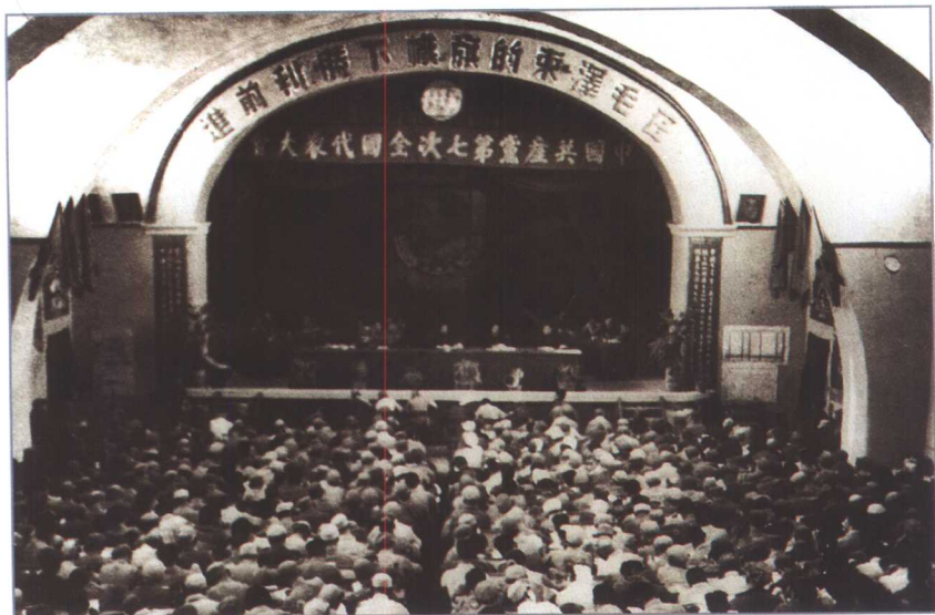
中国共产党第七次全国代表大会会场。