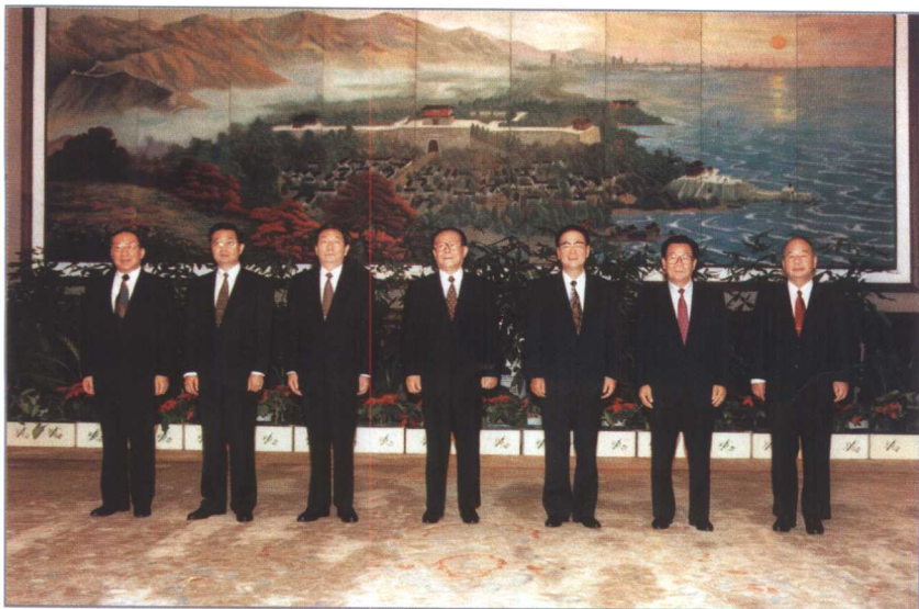
中国共产党第十五届中央委员会政治局常务委员会委员：江泽民、李鹏、朱镕基、李瑞环、胡锦涛、尉健行、李岚清。