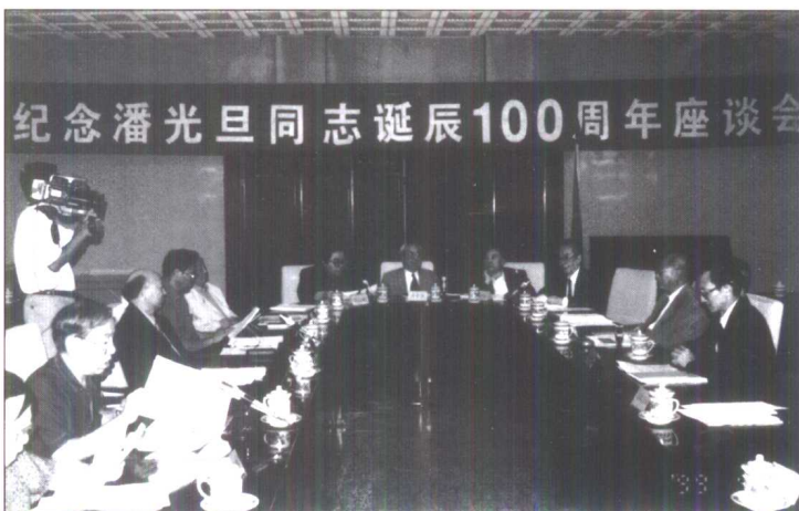
民盟中央、清华大学、中央民族大学联合举办纪念潘光旦诞辰百周年座谈会