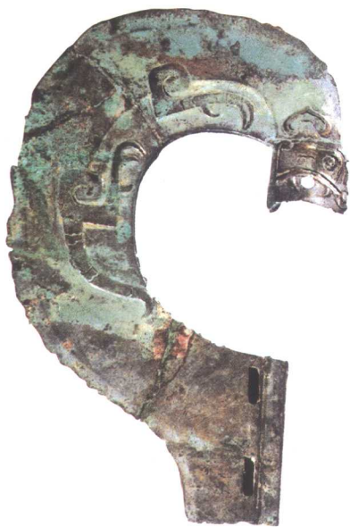
● 虎纹半环形钺 甘肃灵台白草坡出土