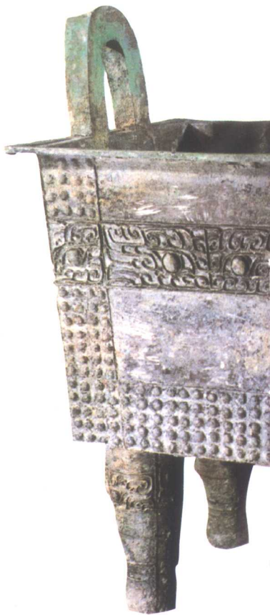
● 二里冈期饕餮纹方鼎 河南