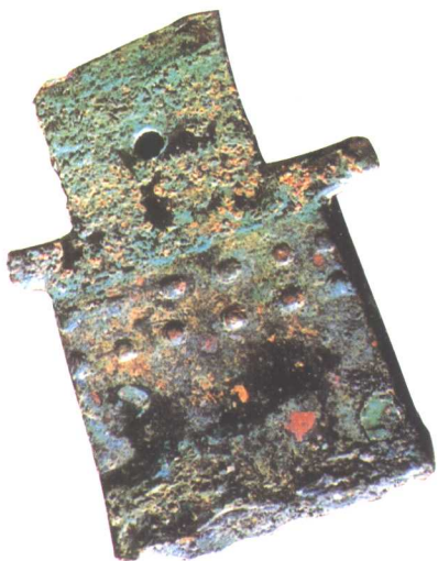
● 铁刃铜钺 商代后期·河北藁城台西出土