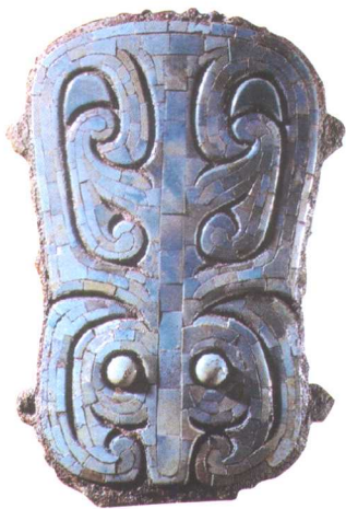
● 二里头文化牌饰 河南偃师二里头出土