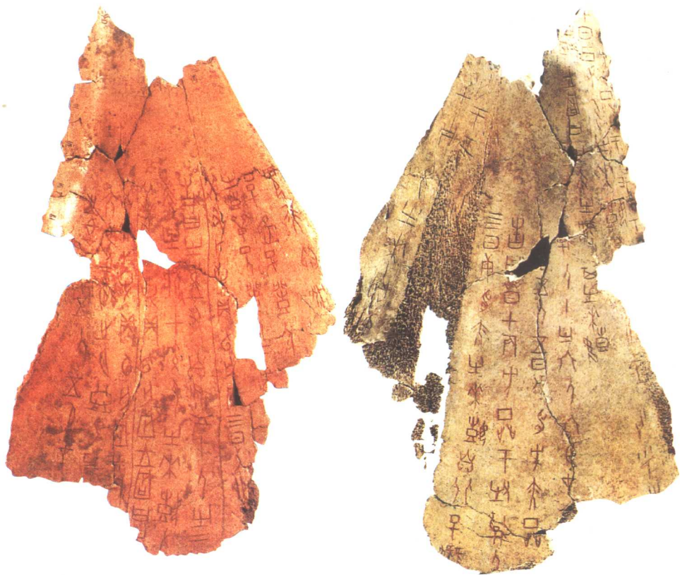
● 奴隶逃亡与征伐卜辞（正、反） 河南安阳出土