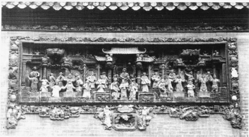
插图一 广州陈家祠堂砖雕人物故事壁画

商人们衣锦还乡的愿望,使徽州建筑富在脸上,平面分割密集,镂工细密,雕刻繁琐深峻,堆砌突出,倒不及扬州青砖大门深藏不露的气派(插图二)。垂花门样式的门楼和门罩为苏州、杭州吸取,进一步往多层次、立体化、精雕细刻发展,清水砖砌牌科 19 ,成牌科门楼,镂雕挂落 20 和栏杆,栏杆下,甚至腾空雕出一排多个荷花柱 21 。其中,苏州砖雕门楼装饰最为集中,节奏最为局促,平面分割成密集的横线竖线,字额左右为兜肚 12 夹峙,像村姑上轿,见出脂粉气。左右粉墙与门楼对比鲜明,黑白两极,又见小家碧玉的秀气(插图三)。比较苏州、杭州砖雕门楼多少沾了些偏安王朝的王气。同样