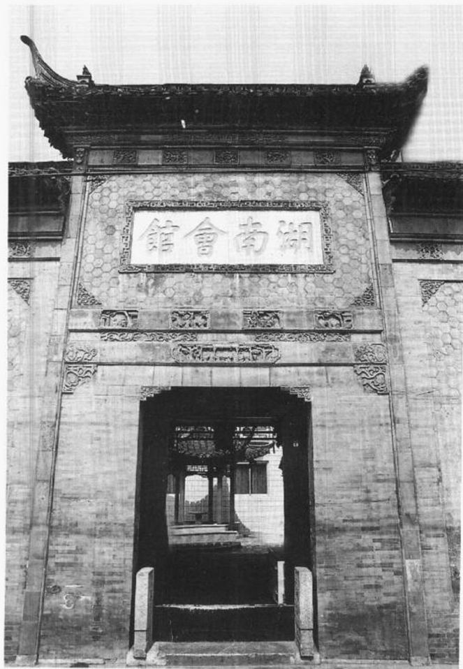
插图六 扬州湖南会馆砖雕门楼

巷内，个园的门在东关街黄宅深巷内，都不是现在模样（现在，园林门前拆成了大马路，园林倒成了广场后的孤岛，进门先见新造的假园。以前进门前的序曲、进门后的曲折和遮挡全没有了）。康、乾二帝各六次南巡扬州，又使扬州园林从城市山林扩而至于湖上园林，瘦西湖到平山堂，“两堤花柳全依水，一路楼台直到山” [18] 。乾隆间李斗借刘大观语云：“杭州以湖山胜，苏州以市肆胜，扬州以园亭胜，三者鼎峙，不可轩轻” [19] ，可见，乾隆间扬州园林的声誉，在苏州园林之上。