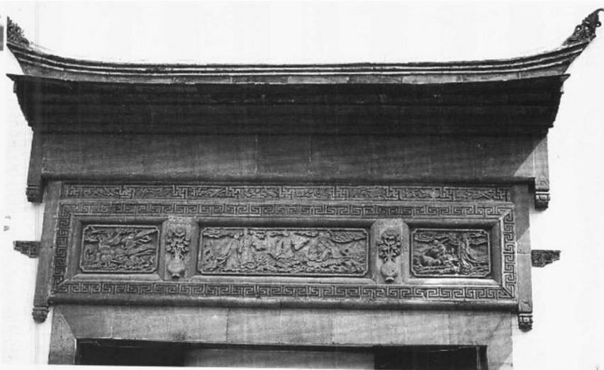
插图七 南京甘熙故居砖雕门罩

夹径、环山之垣，或宜石宜砖，宜漏宜磨，各有所制。从雅遵时，令人欣赏，园林之佳境也。历来墙垣，凭匠作雕琢花鸟仙兽，以为巧制，不第林园之不佳，而宅堂前之何可也” [22] 。可见，门窗框宕用清水细砖镶贴，明代已经流行于江南，先贤竭力称道的是磨砖门景、洞窗和漏窗，反对的是雕镂、堆塑花鸟仙兽的壁窗，其理由