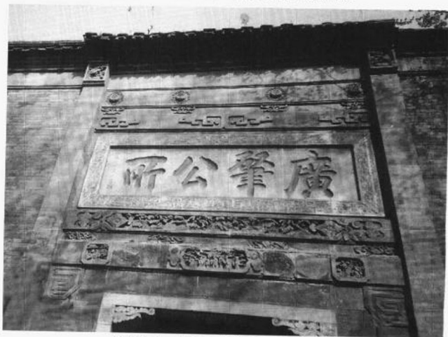
插图五 镇江广肇公所砖雕大门