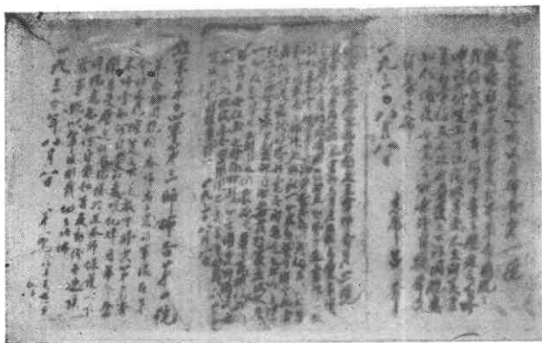
△启东“八八”暴动时，以红十四军三师等名义发布的布告。