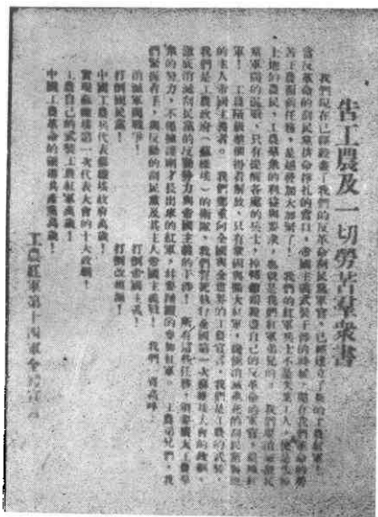
▷右图是红十四军《告工农及一切劳苦群众书》传单。