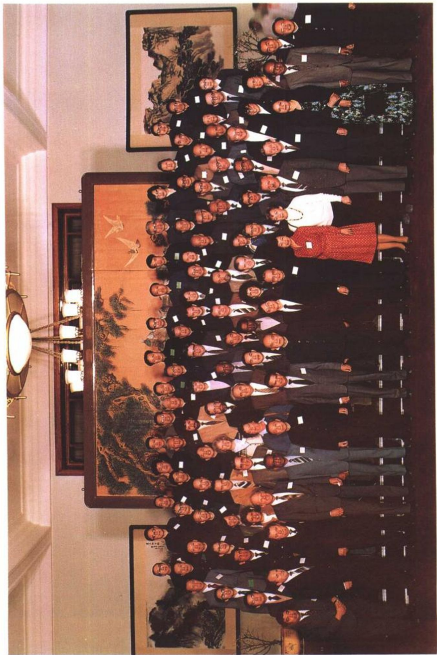
中华人民共和国国务院副总理姚依林接见会议全体代表