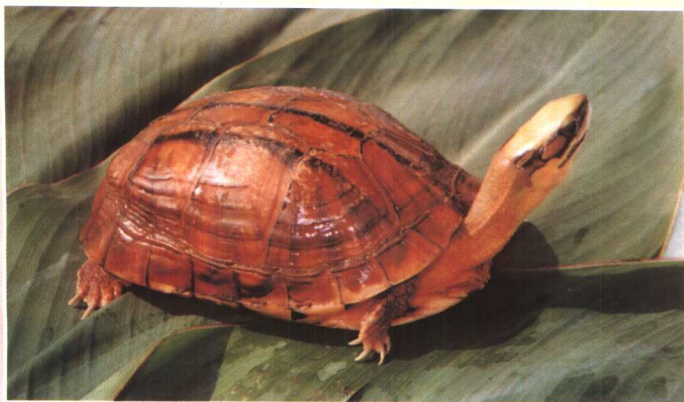
金钱龟 (三线闭壳 龟)成体