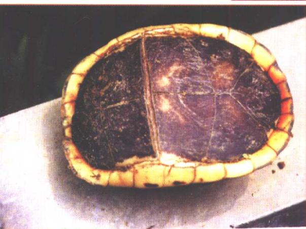
金头龟（黄缘盒龟）的闭合状态