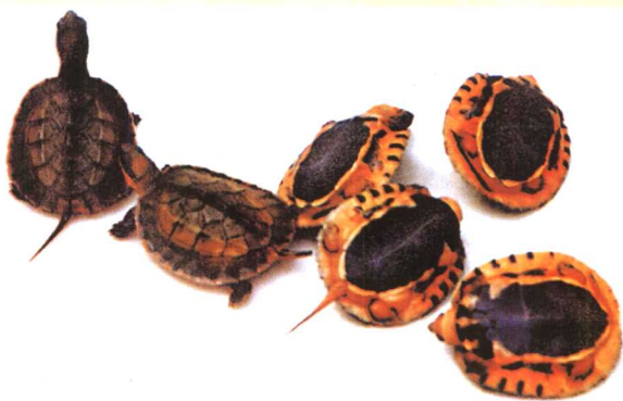
金钱龟(三 线闭壳龟)幼体