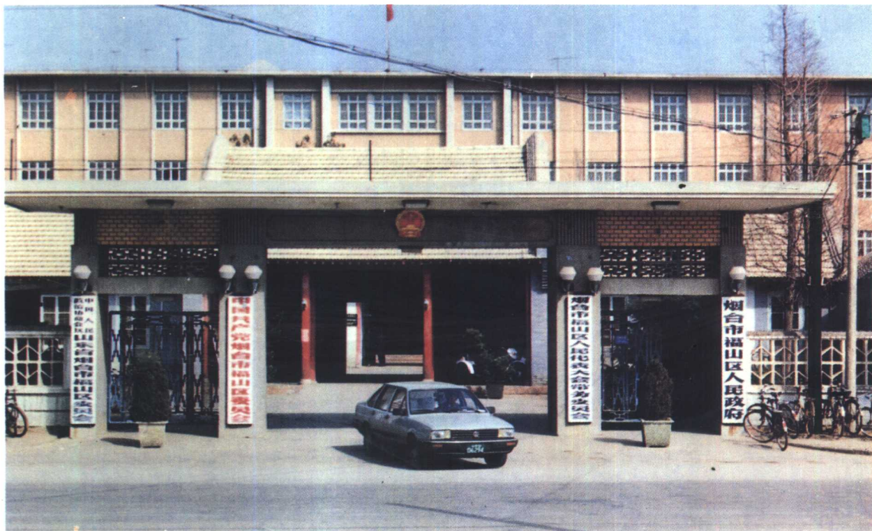
福山区党政机关办公楼