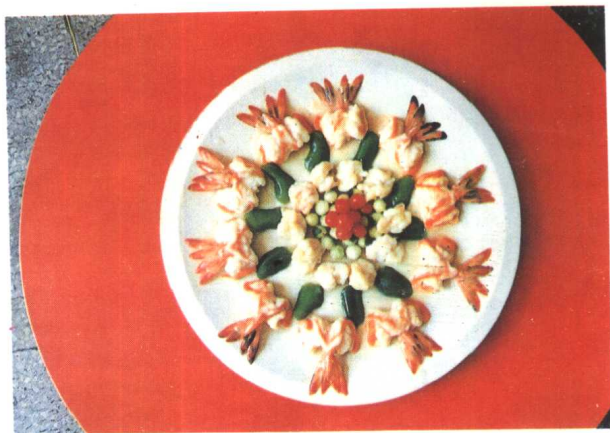
福山工艺菜——花鼓大虾