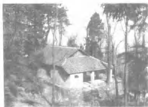
砾山红军游击司令部驻地砾山之旧址。