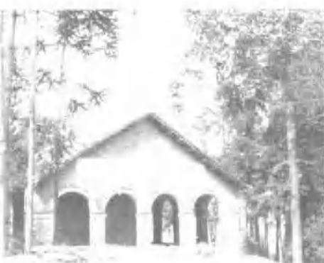
谷城县苏维埃政府驻地砾山之旧址。