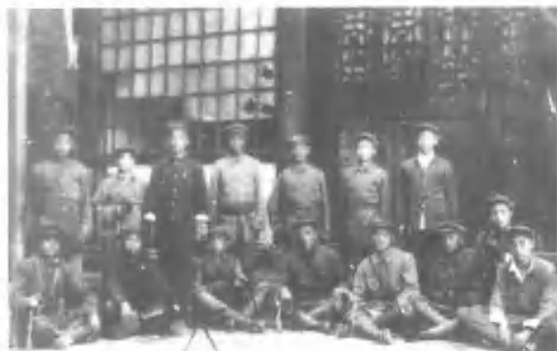
谷城县公安武装一九四九年春进驻谷城县城时留影