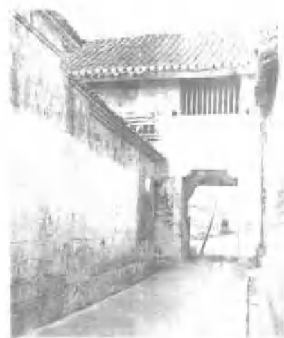
1931年5月16日，红三军占领石花后，在石花抚州城内山贺龙。邓中夏主持召开前敌委员会，决定攻打阳州、占领武当等行动计划。图为会议旧址。