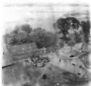
1939年5月至1941年间中共鄂西北区党委在茨河关帝庙创办的鄂北手纺织训练所全景。