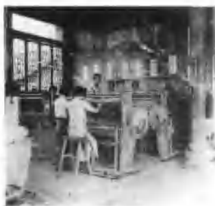
图为学员们正在紧张的进行手纺织训练。