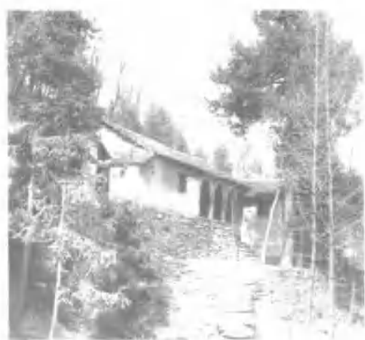
谷城县委1930年至1931年驻地砾山之旧址。