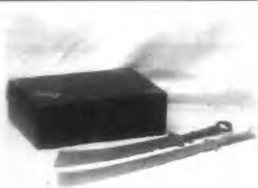
当年红军游击队用过的大刀和地下工作者装文件用的皮箱。