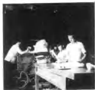
图为学员在进行轧花训练。