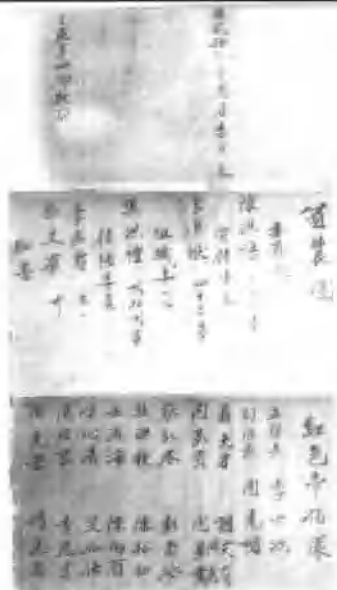
图为一九三一年盛嫌区九里坪乡（即三区四乡）工农政权群众团体组织花名册