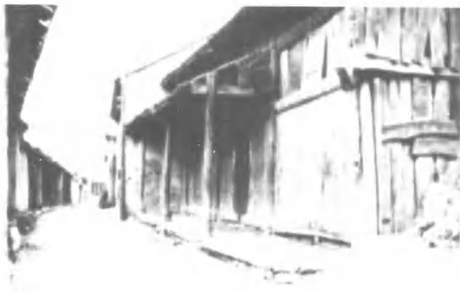
1931年，贺龙、邓中夏、柳直庆率红二军主力进入谷城大观音堂，在此汇合雍山红军游击队。图为大观音堂旧址。