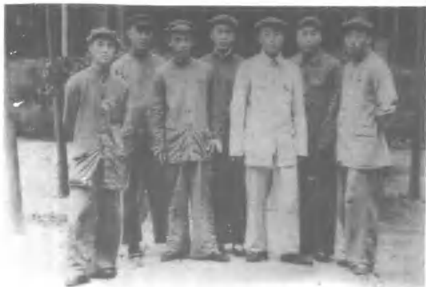
1940年春谷城党政部分领导人在进川抗敌时合影