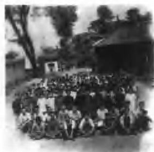
1939年5月1日茨河鄂北手纺织训练所开学时全体学员合影。