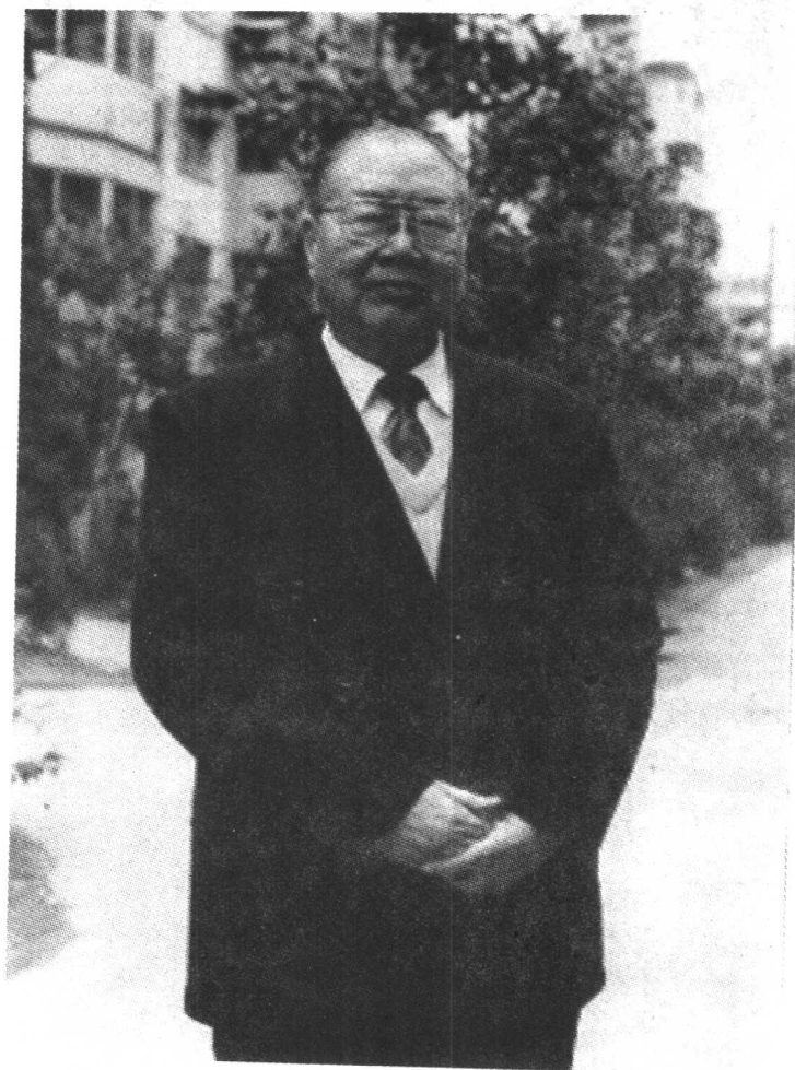
1998年3月在寓所前闲眺