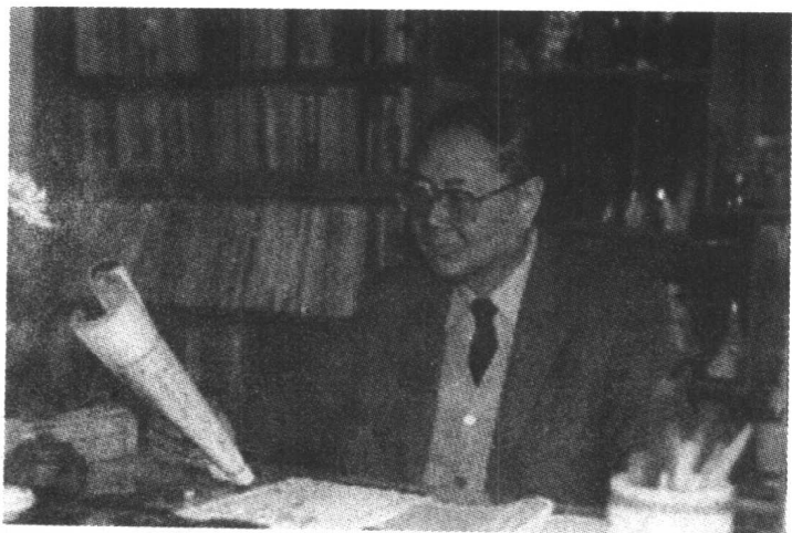
1997年 在书斋温故知新