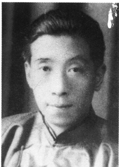
作者像(1929年攝于商務 印書館)