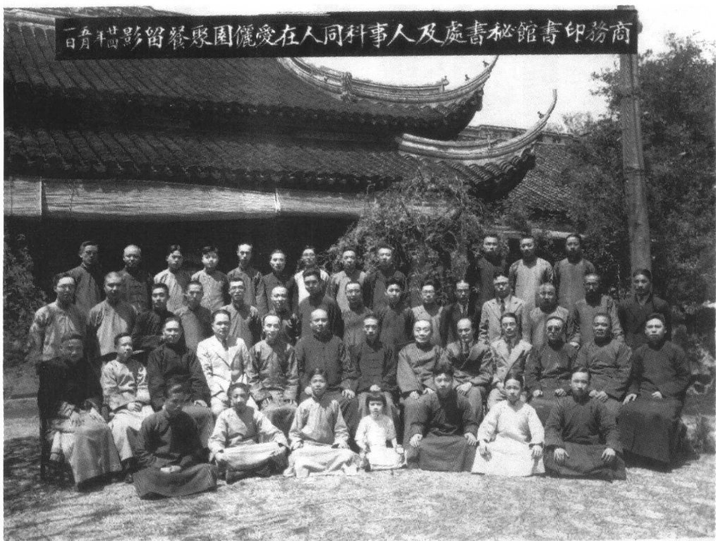
商務印書館秘書處合影(1935年)