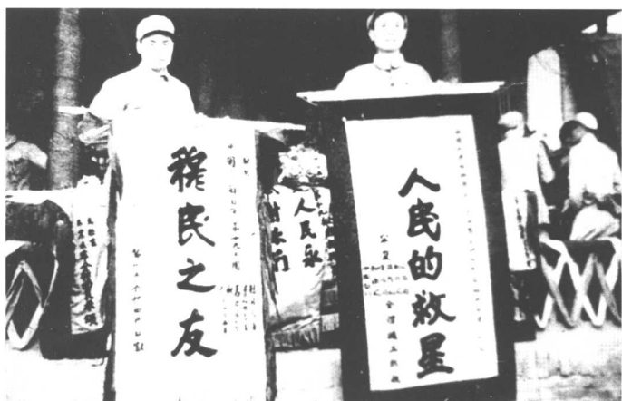
银川各族人民召开祝捷大会， 向第十九兵团首长赠送锦旗。