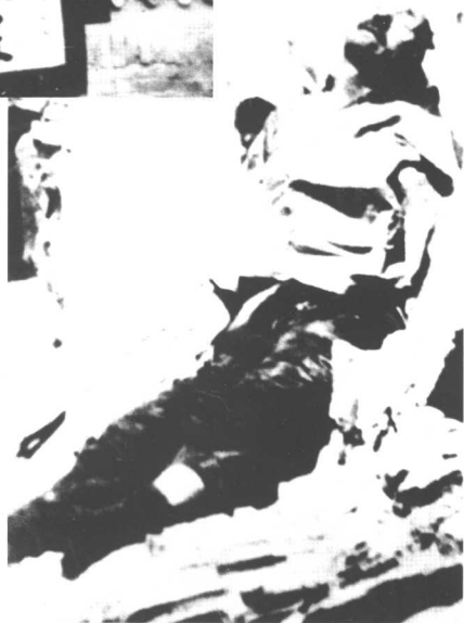
青海匪首马元祥被击毙。