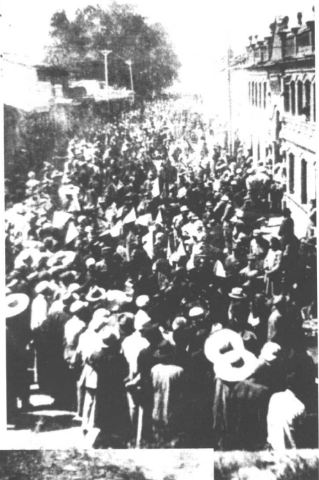
解放后的人民热烈欢迎解放军。