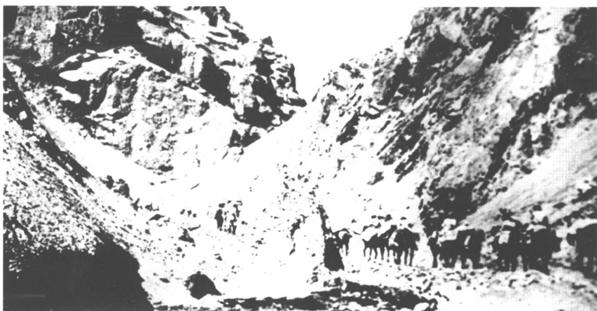
新疆军区独立骑兵师一部向西藏阿里高原进军。