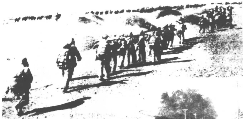
进驻青海的第一军二师六团官兵，穿戈壁、闯大漠掩护运送弹药的骆驼大队。