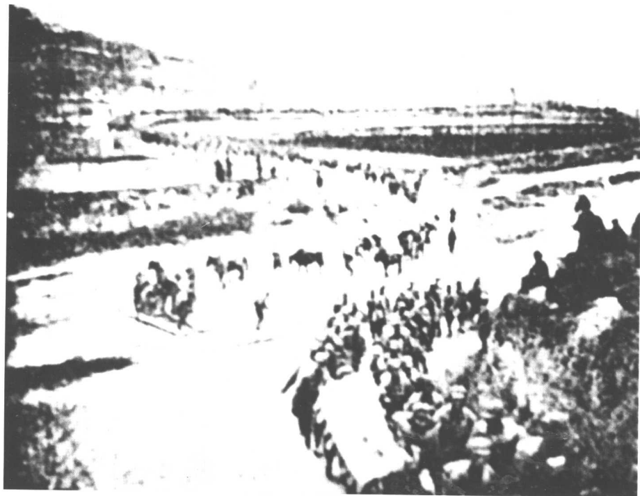
在陇南担任剿匪的第七军向土匪驻地挺进。