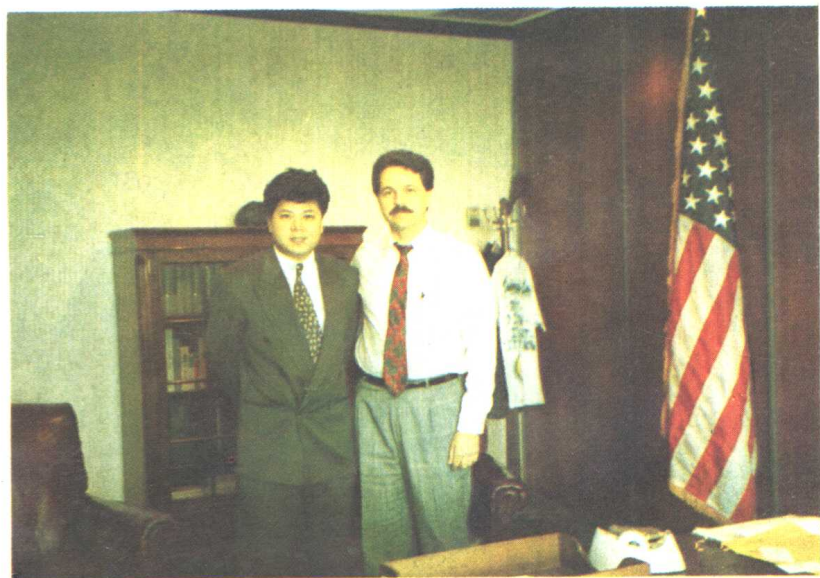
张晓武与迈阿密移民局局长沃特·凯德曼