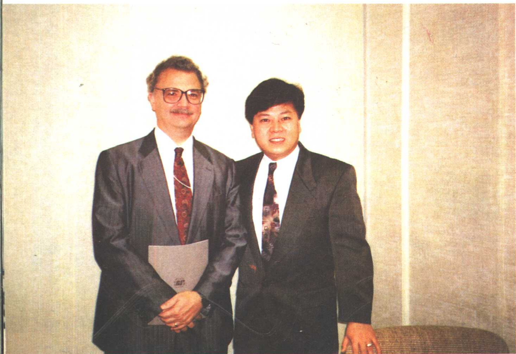
张晓武与美国国务院中国处副处长马海黎在美国国务院合影