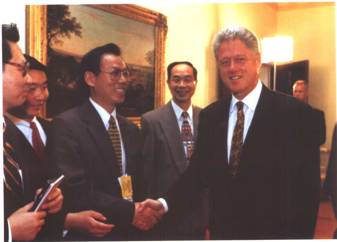
作者与克林顿握手 1998年6月19日