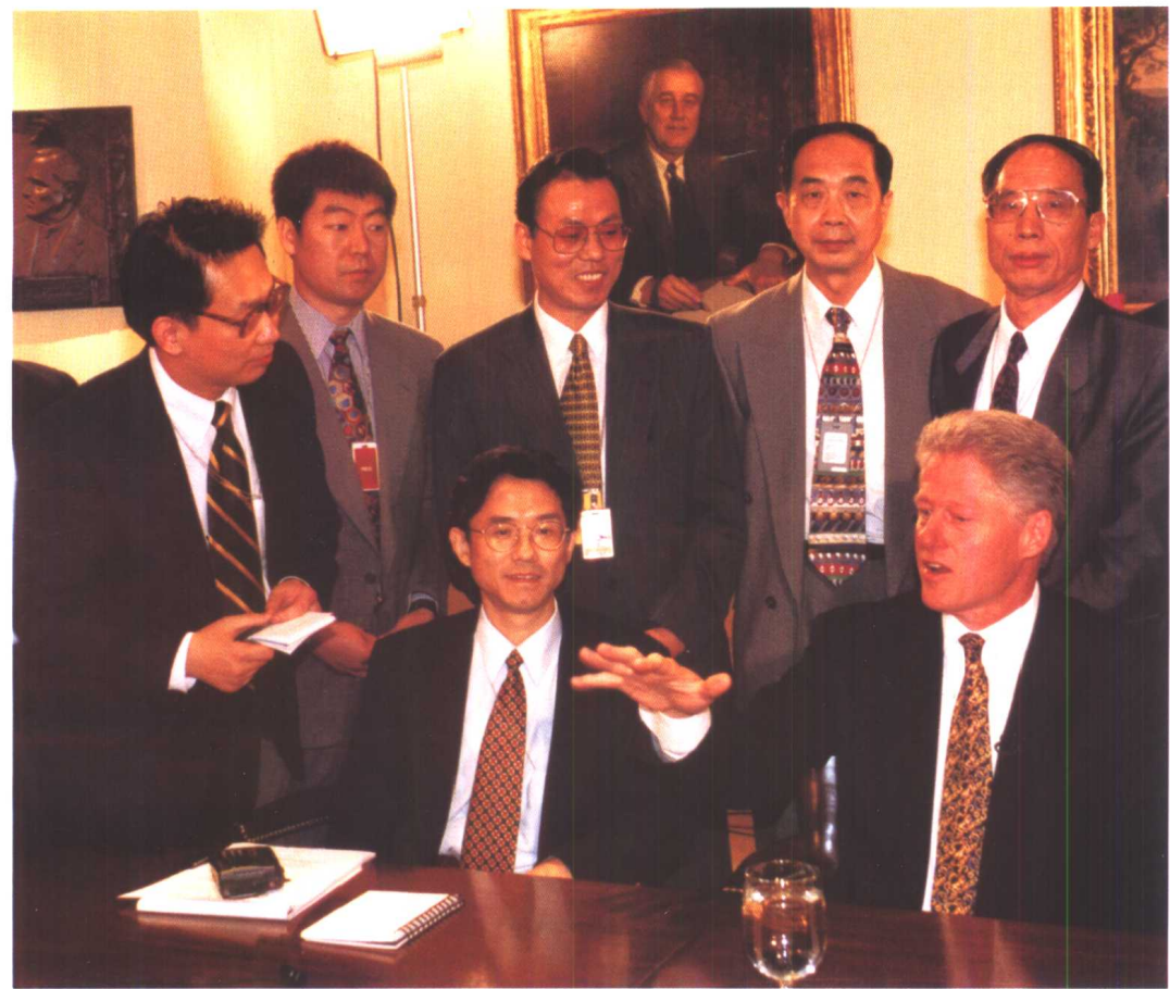
克林顿在白宫接受中国常驻记者的采访。1998年6月19日