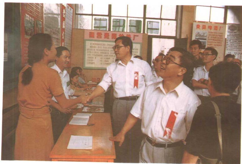
市委书记李万禄、市长刘也强到人才交流会看望工作人员。