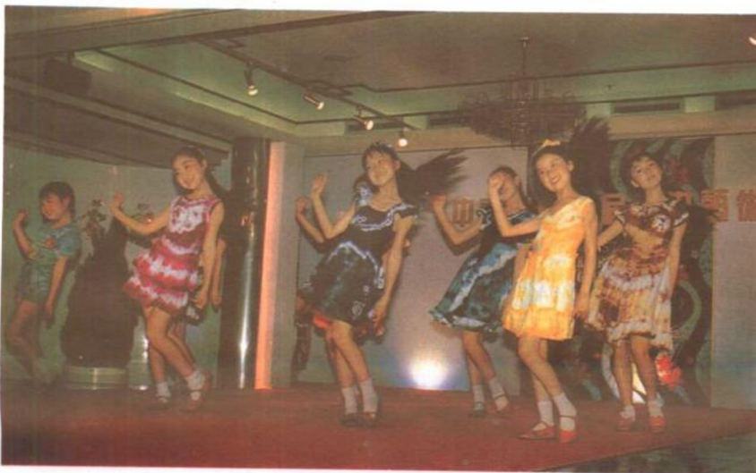
苗苗艺术团的孩子们身着蜡染服装为艺术节助兴。