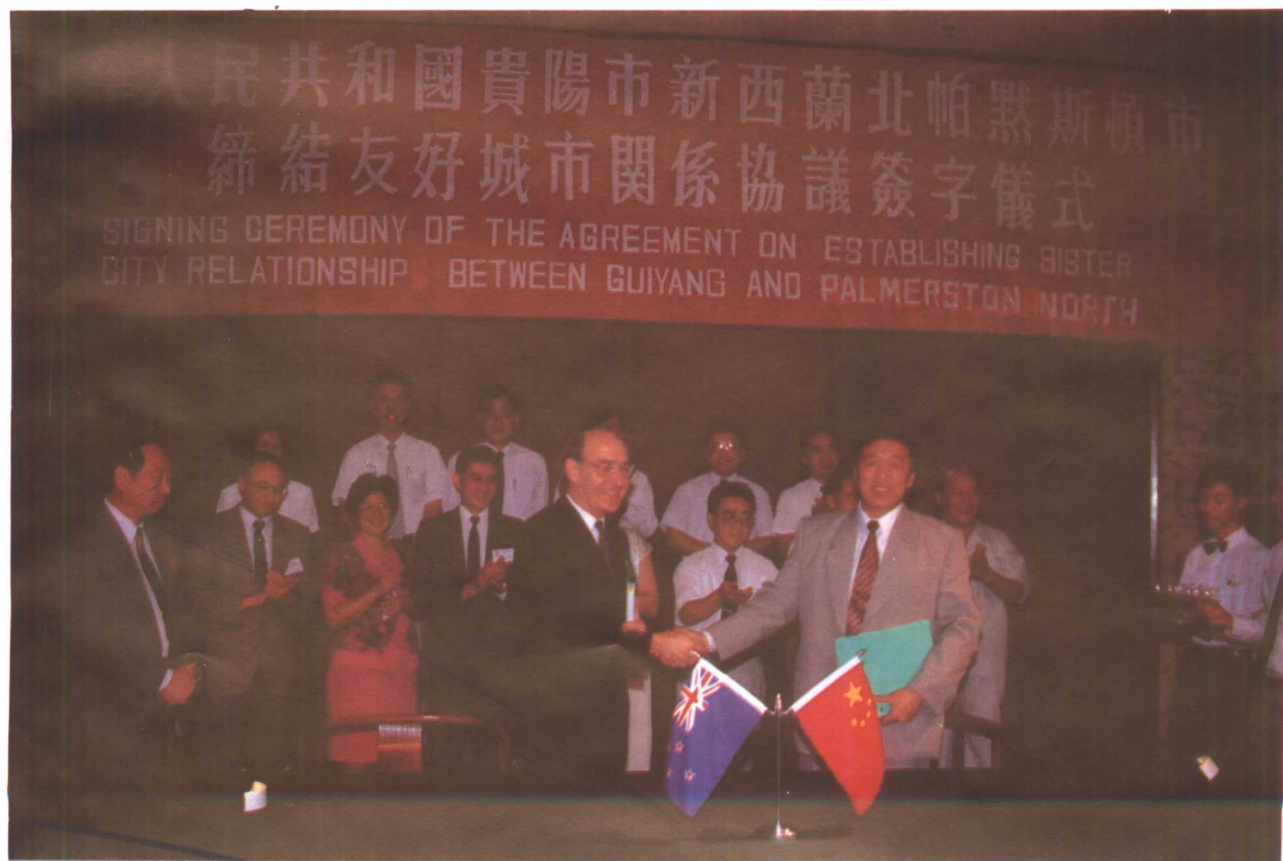
8月17日,贵阳市与新西兰北帕默斯顿市缔结友好城市关系协议签字仪式在贵阳举行。