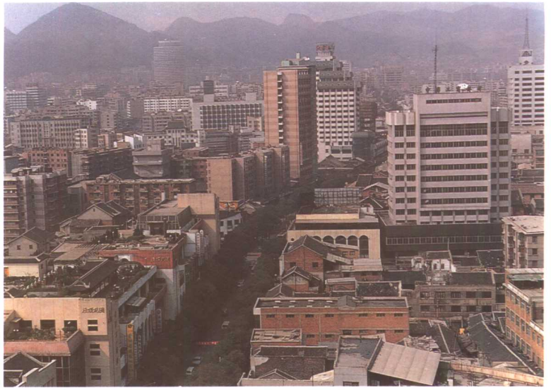
贵阳市中心区新貌。