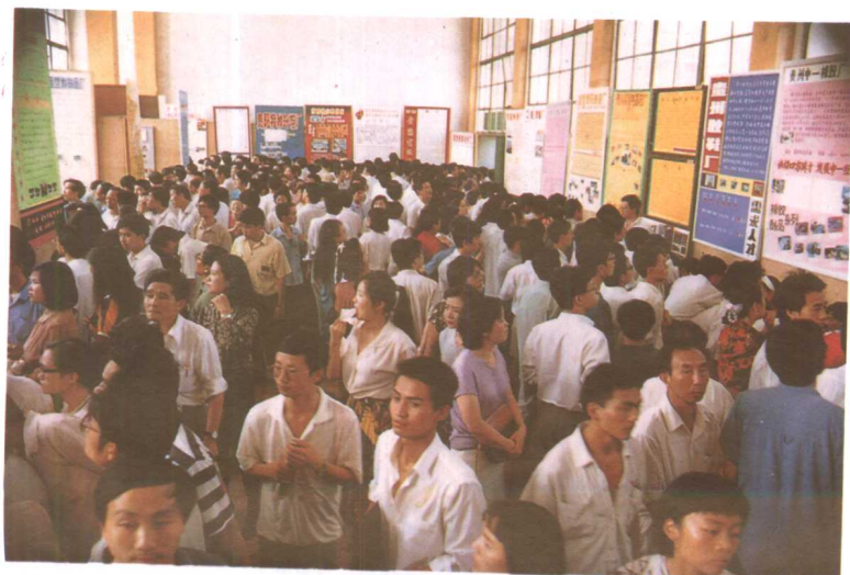
熙来攘往的交流会大厅。