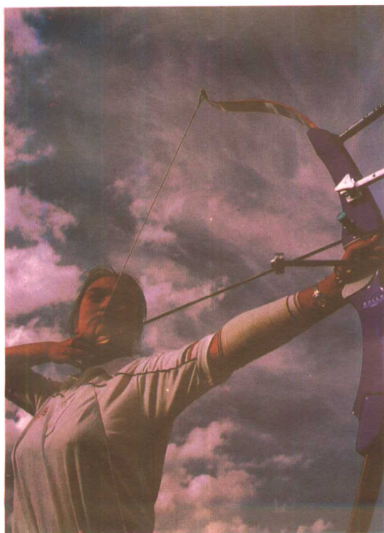
八运会射箭女运动员英姿。