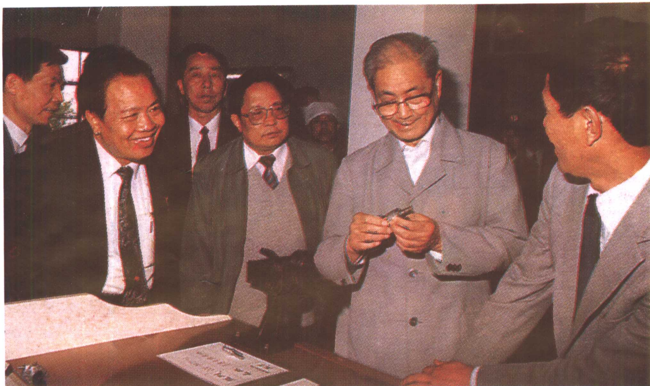
1992年5月,中共中央政治局委员宋平在贵阳小河工业区143厂视察。