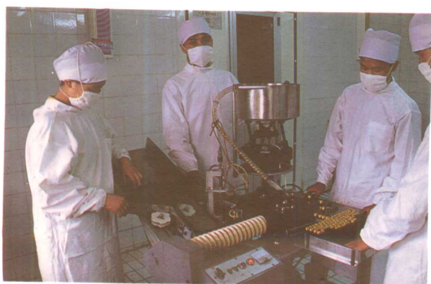
贵阳龙发保健药品厂“老来福”无菌灌封。