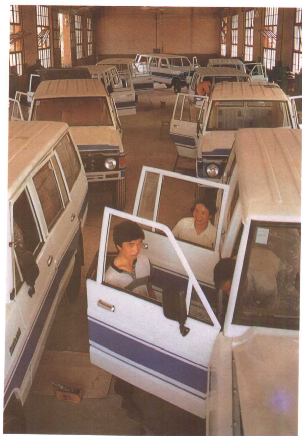
总装中的“贵州”牌越野车。