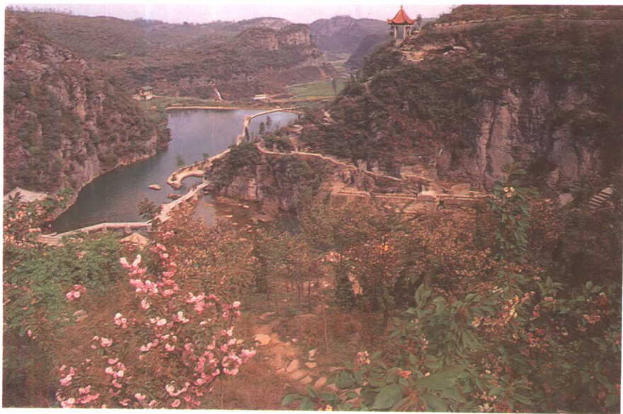
新开发的花溪风景区天河潭景点。