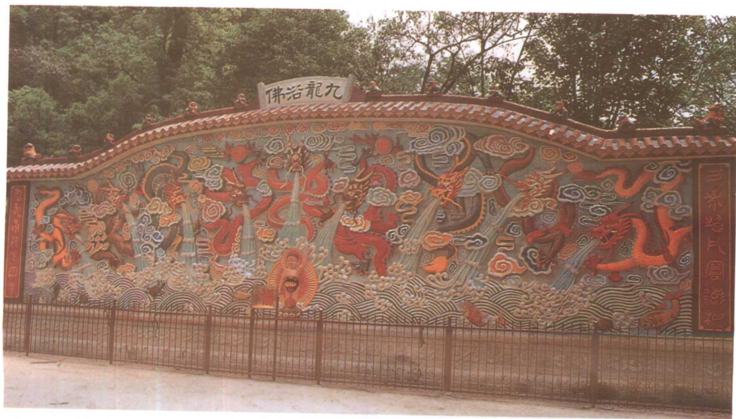
黔灵山弘福寺新建的“九龙浴佛”石碑。