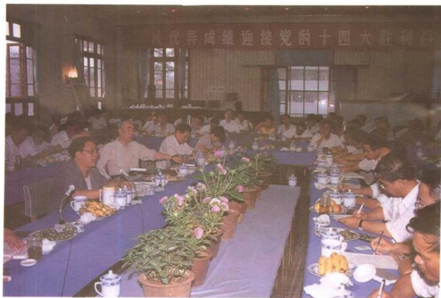
省委书记刘正威、省长王朝文带领有关部门负责人到贵阳市现场办公，共商建设内陆开放城市的大计。