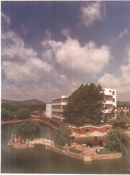
全国花园式工厂——铁道部贵阳车辆厂一景。