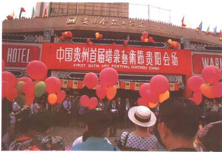
1992年4月举行的“中国贵州首届蜡染艺术节”贵阳会场开幕仪式。