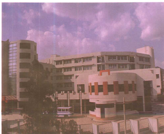
贵阳实验二中教学楼落成并开始招生。