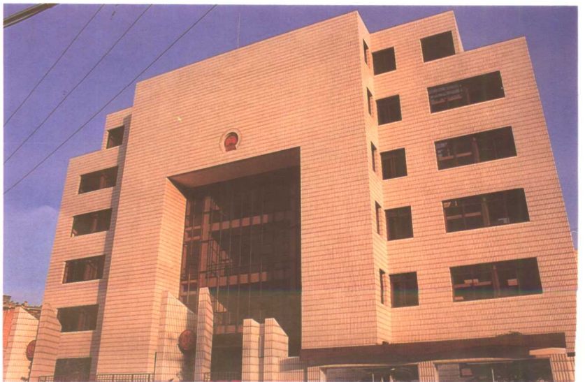
新建的云岩区人民法院。