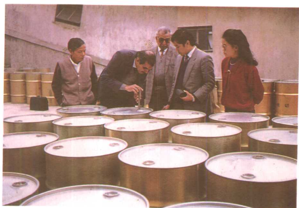
外商在青岩黄磷厂检测产品。