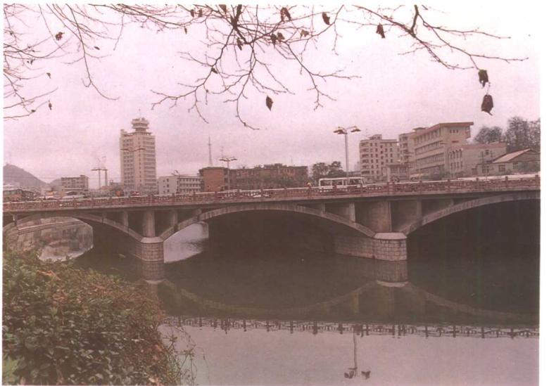
横跨南明河的瑞金南路新桥。