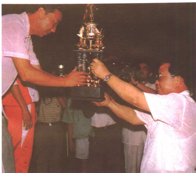
省委书记刘正威为八运会获团体总分第一名的贵阳队颁奖。