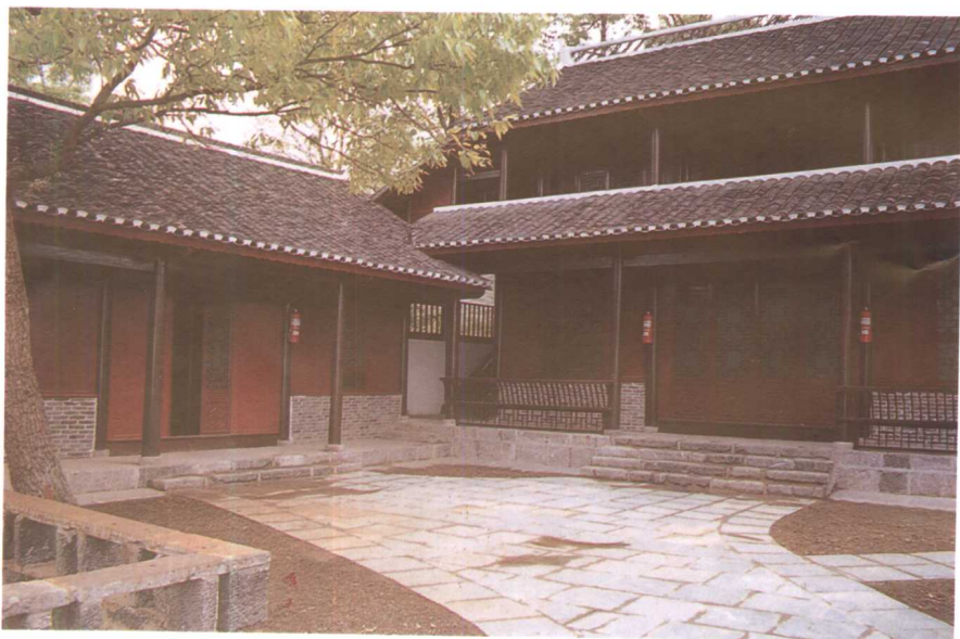
清代贵阳著名学者周渔璜青年求学的桐桡书屋已修葺一新。