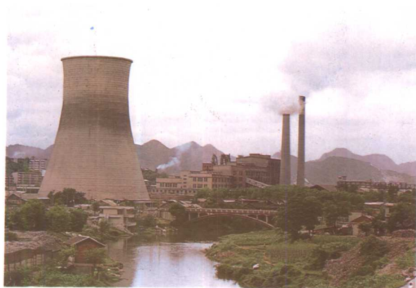
贵阳发电厂新建的冷却塔。