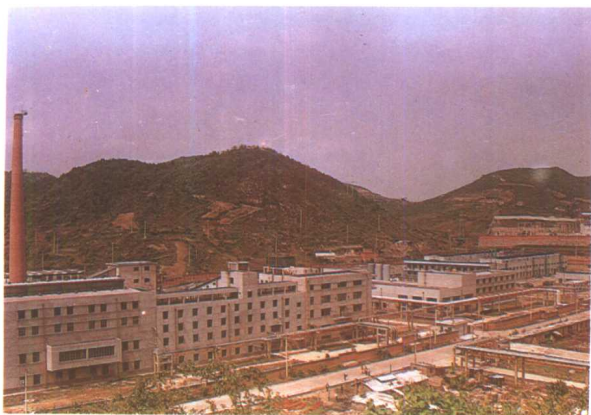
初具规模的贵阳高新技术开发区。（石亚平 摄）