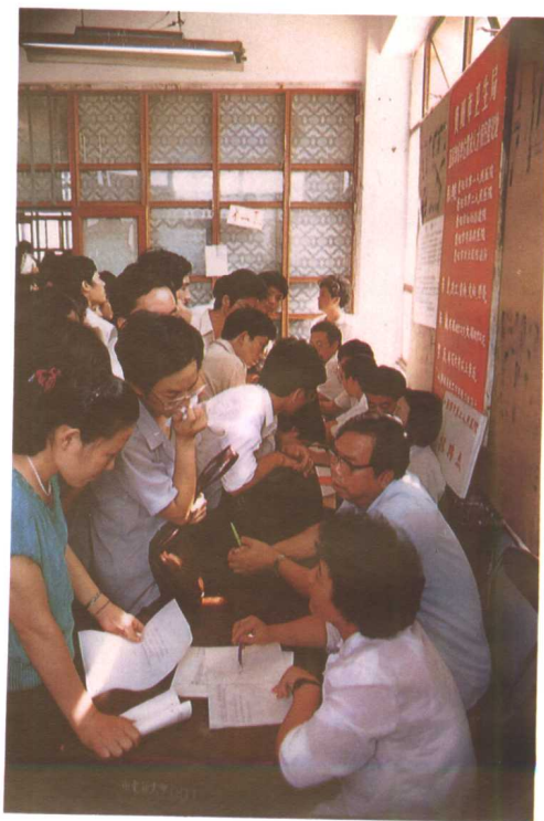
各招聘点上挤满询问的人。