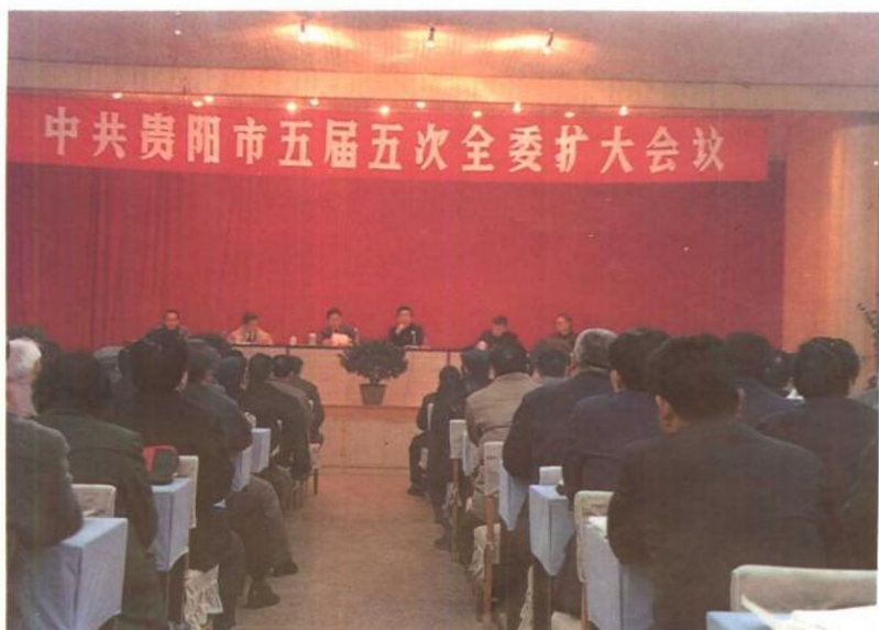
中共贵阳市五届五次全委扩大会议会场。