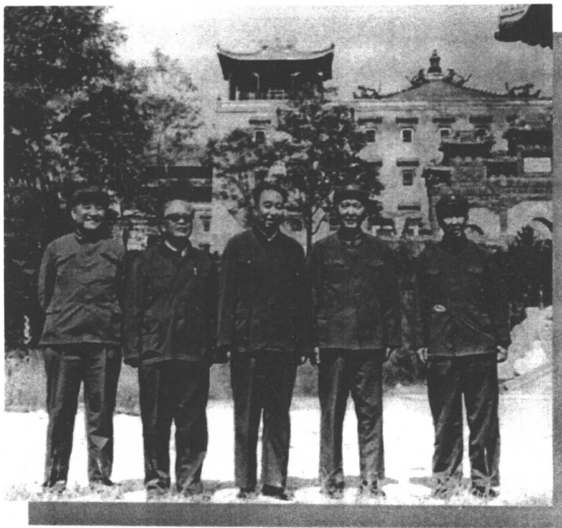
周惠与华国锋在河北承德。