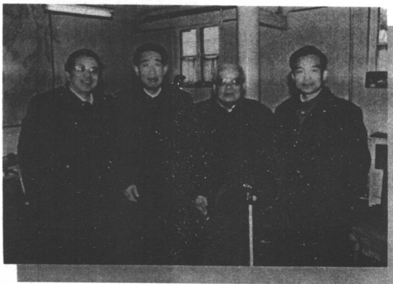
1991年春节，温家宝（右一）、曾庆红（左一）、杨德忠（左二）给周惠拜年。