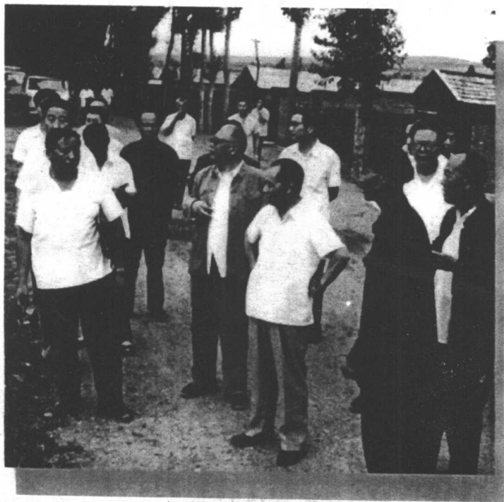
周惠与胡耀邦在内蒙古昭盟赤峰。