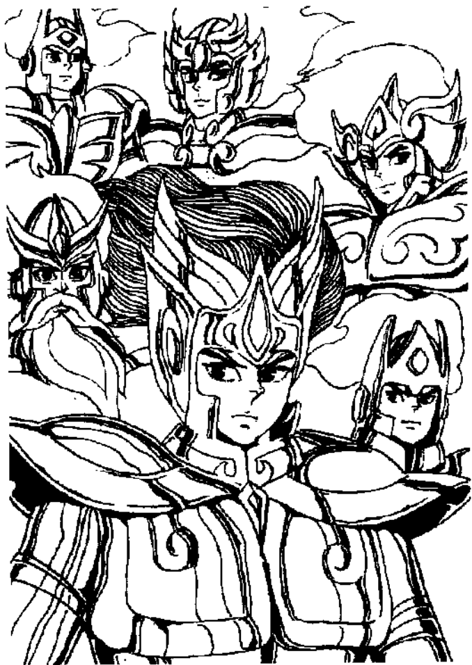
江格尔和他手下的勇士们。