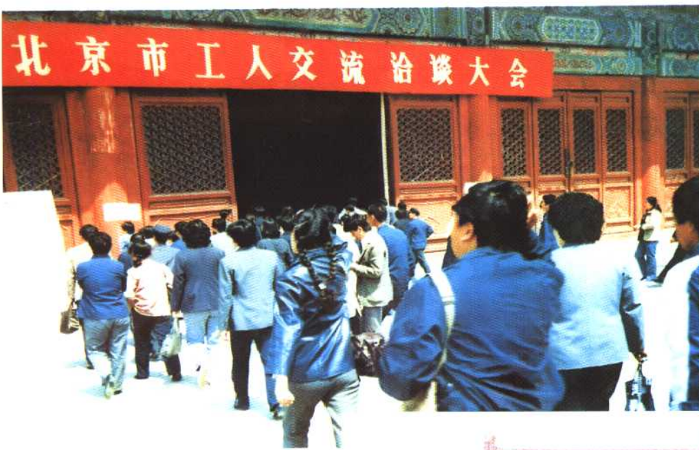
1987年5月4日在劳动人民文化宫举办的首届北京市工人交流洽谈大会外景