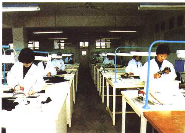
1993年北京市第二轻工业学校学生服装 制作实习现场