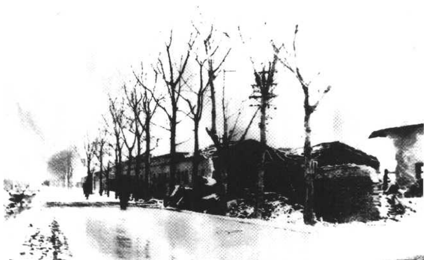
1981年2月四季青轮胎翻修厂立式锅炉爆炸现场及爆炸后锅炉外壳飞出481.4米落地后惨状