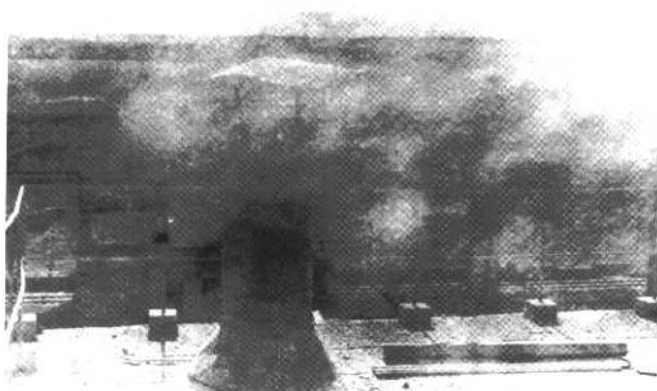
八十年代初期首都钢铁公司耐火材料厂粉尘治理前后状况