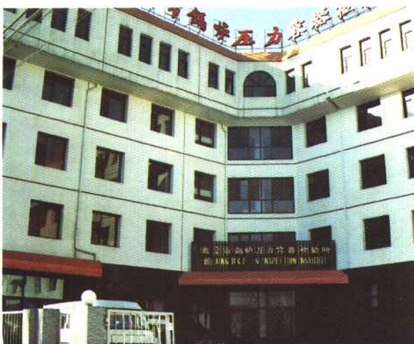
1992年11月新建成的北京市劳动局锅炉压力容器检测检验所办公大楼