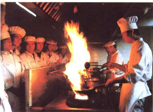
1993年北京市服务管理学校学生烹饪实习 现场