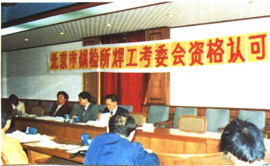
1993年4月召开的北京市锅检所焊工考委会资格认可会