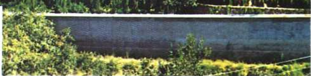
1992年12月建成的北京市退休职工活动站—碧海山庄