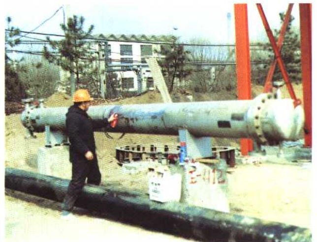
检测检验所技术人员正在检测检验高压容器