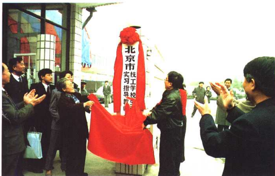
1994年北京市技工学校 生产实习指导教师培训中心 落成