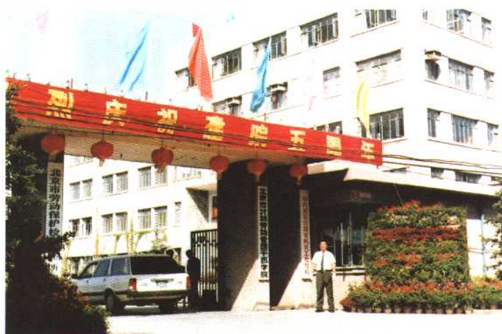
1991年6月北京市计划劳动管理干部学院外景