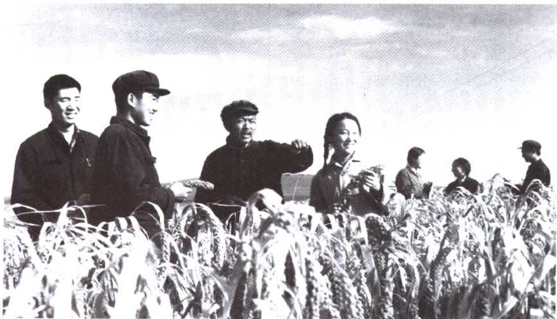
六十年代北京知识青年和当地农民在田间