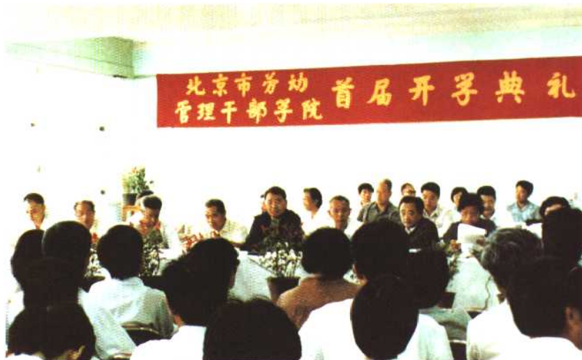
1986年9月北京市劳动管理干部学院首届开学典礼