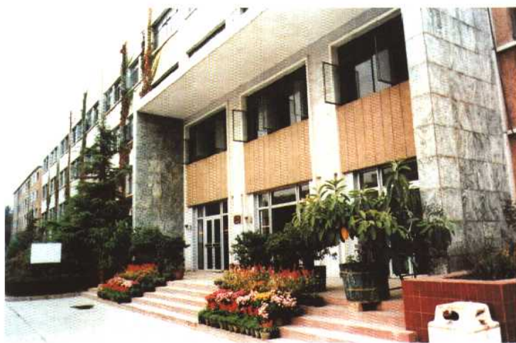
北京市计划劳动管理干部学院教学楼