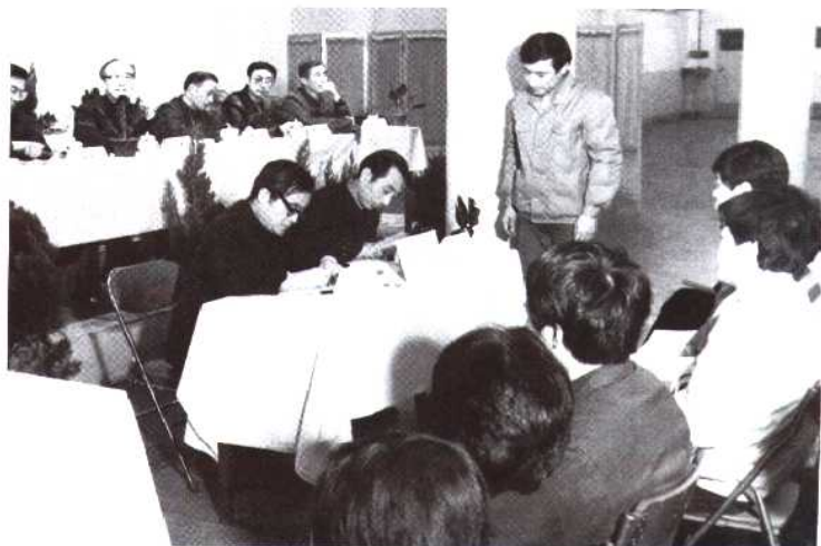
1989年1月北京化工机械厂全员劳动合同制签约鉴证现场