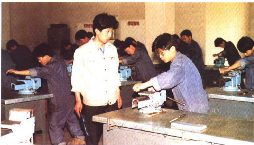
担任实习指导教师的技 校毕业生在指导学生上实习 课