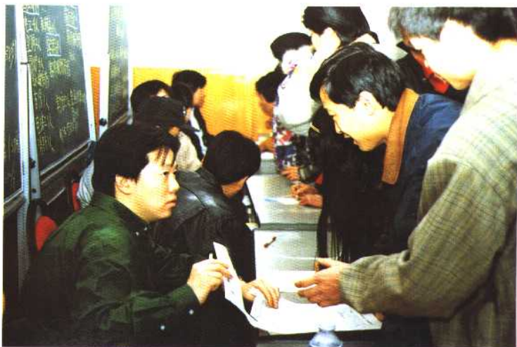
1994年底北京市职业介绍服务中心成立，图为洽谈招聘会现场