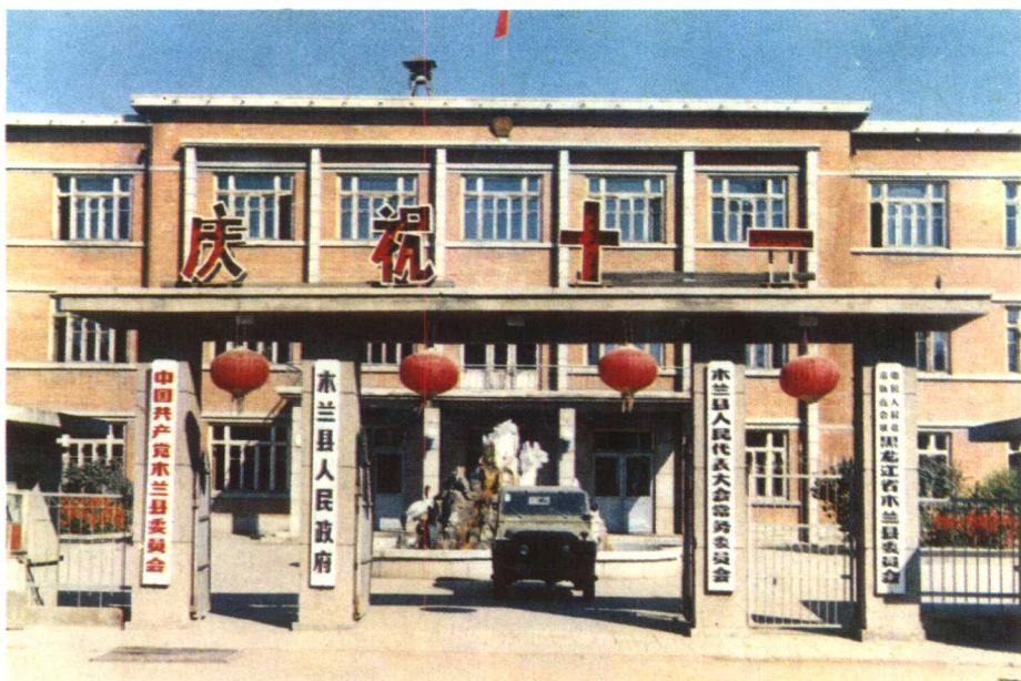
县委、县人大、县政府、县政协机关