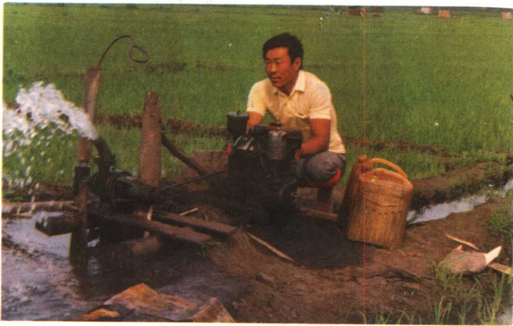
灌溉、种植水稻 利用地下水