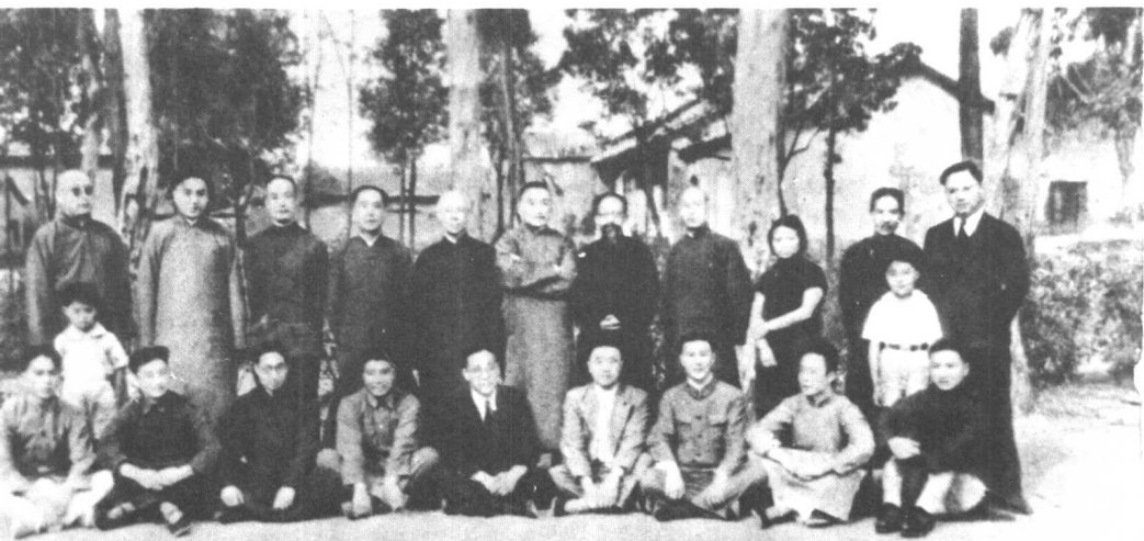
1939年4月中华职业教育社在昆明举行工作讨论会，规划抗战时期的工作方向。后排左六为黄炎培。