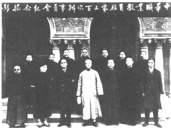
1928年12月中华职业教育社在上海举行第三次办事员会议。后排左三为黄炎培。