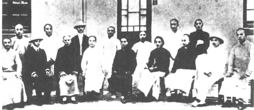
黄炎培应杨斯盛之请，于1906年在上海创办浦东中学并担任校长。图为1907年黄炎培（后排右一）与浦东中学校董、教师合影。