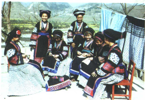
▷ 布依族妇女在刺绣