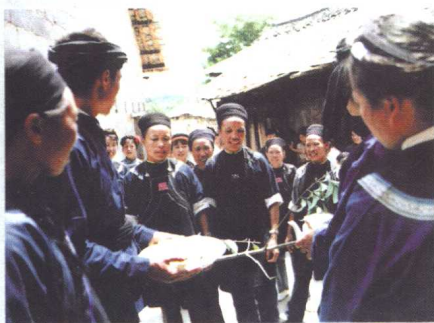
▽ 花溪区布依族拦路酒