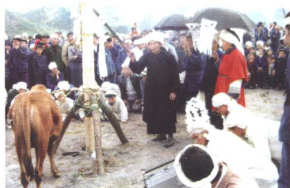
△ 贵定县沿山一带 布依族丧葬砍牛仪式