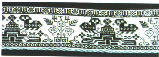
惠水县长安乡布依族刺绣