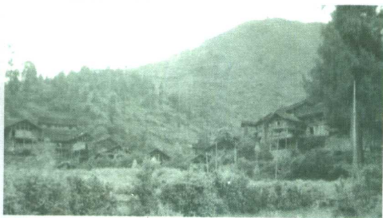
◁平塘县布依族干阑建筑