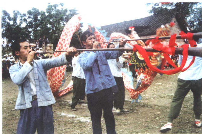
▷ 吹长号舞狮迎亲人