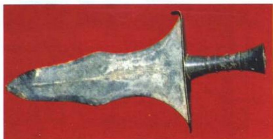
◁ 在布依族聚居的黔西南布依族苗族自治州兴义市出土的一字曲刃剑，是古夜郎文化的证据。