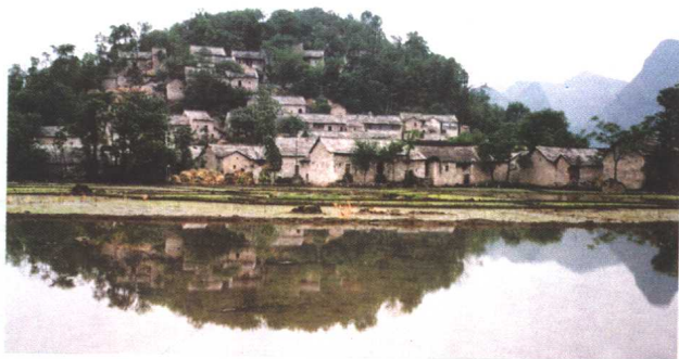
▷布依族蜡染之乡——石头寨 马启忠 摄