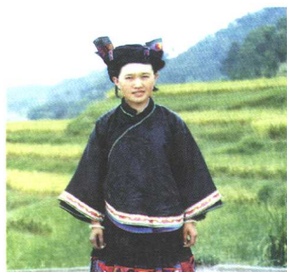
△惠水县长安乡布依族女装