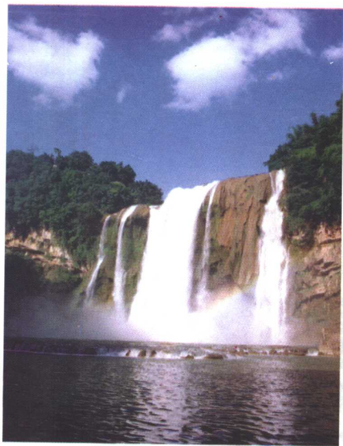
▷黄果树瀑布