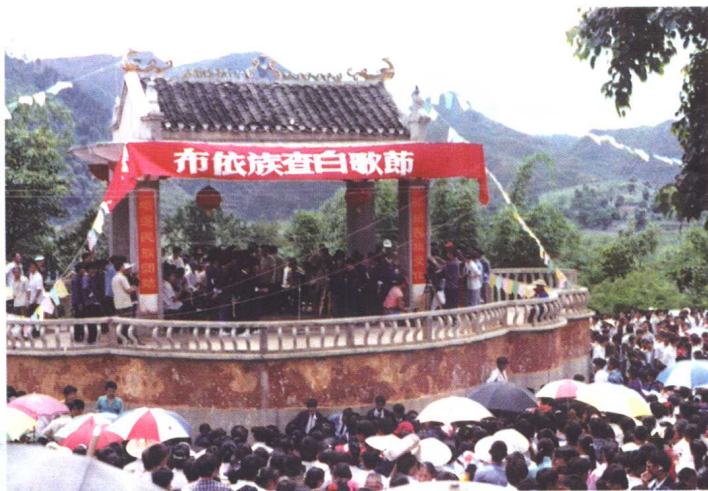
◁ 兴义市布依族查白歌节