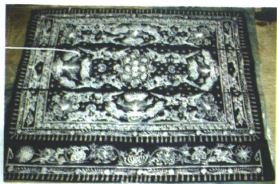
△ 惠水县雅水镇布依族蜡染