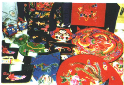
△ 独山县布依族刺绣