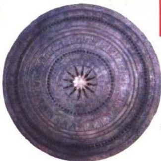
◁ 布依族铜鼓