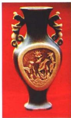
▷ 平塘县牙舟陶器