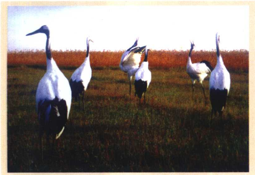
齐齐哈尔扎龙湿地