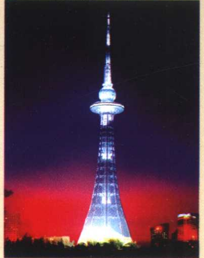
龙塔之光—黑龙江电视塔