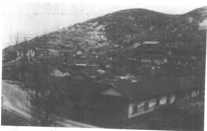
中华钨矿公司旧址。