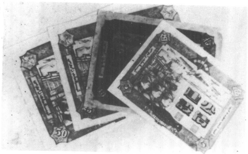
毛泽民任新疆省财政厅代厅长时发行的“建设公债”。