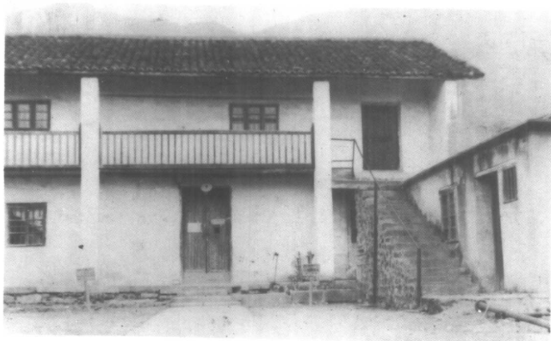
中华钨矿公司医院住院部旧址。