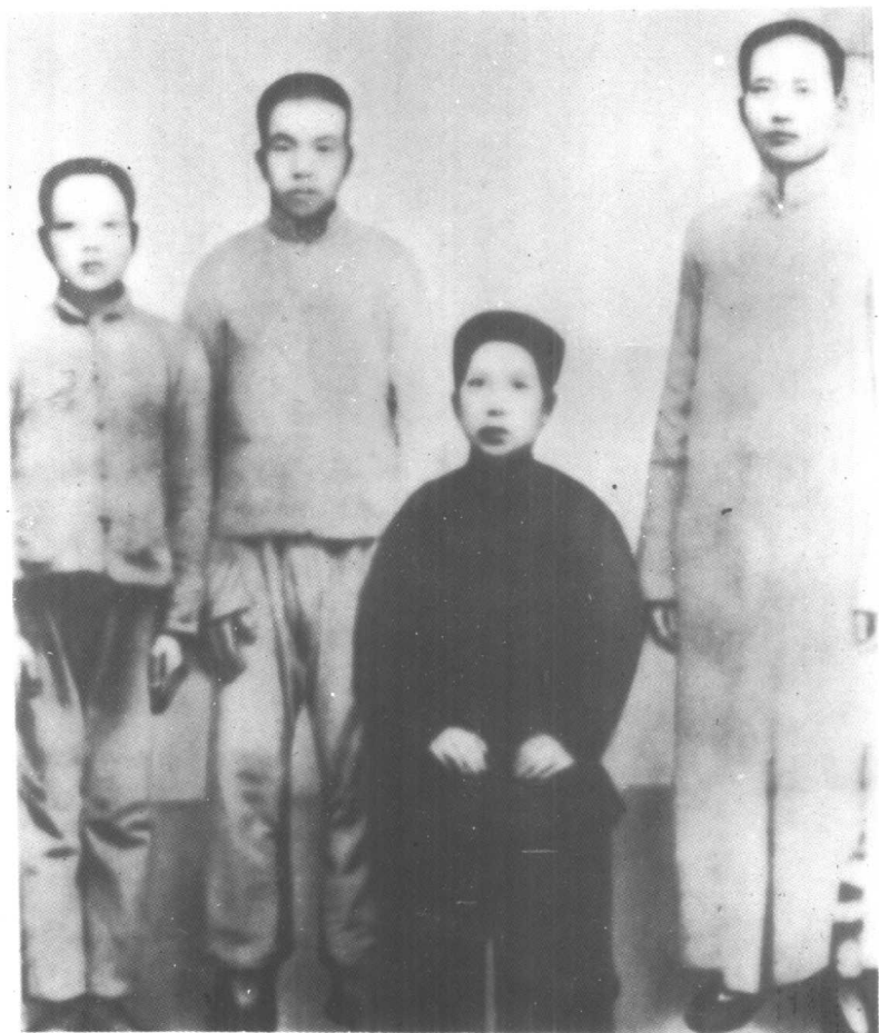
1919年毛泽民三兄弟和母亲合影。