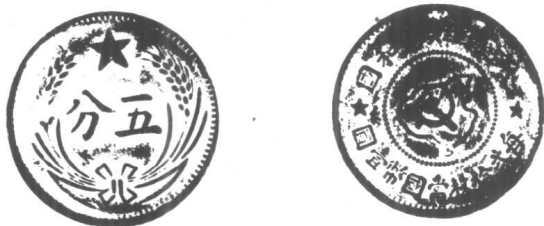
中华全国苏维埃国家银行发行的铜元。