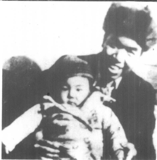
一九四一年冬，毛泽民与儿子毛远新在迪化。