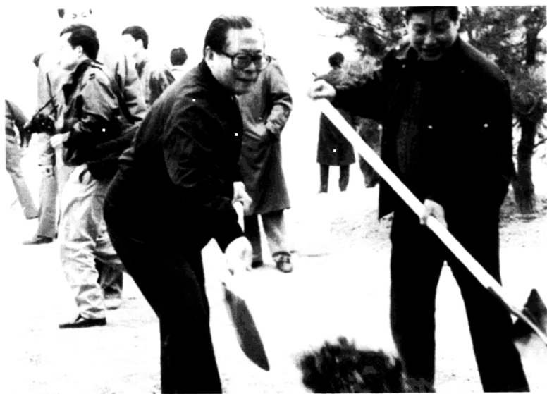
1991年4月7日，江泽民在北京丰台区花乡森林公园参加义务植树劳动