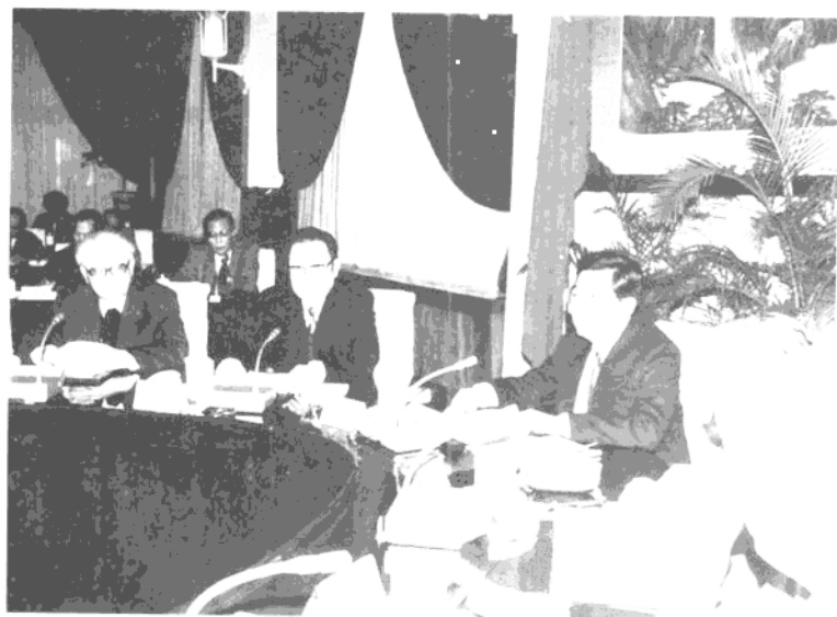
1995年10月8日，胡锦涛在全国农 村基层组织建设经验交流会上讲话