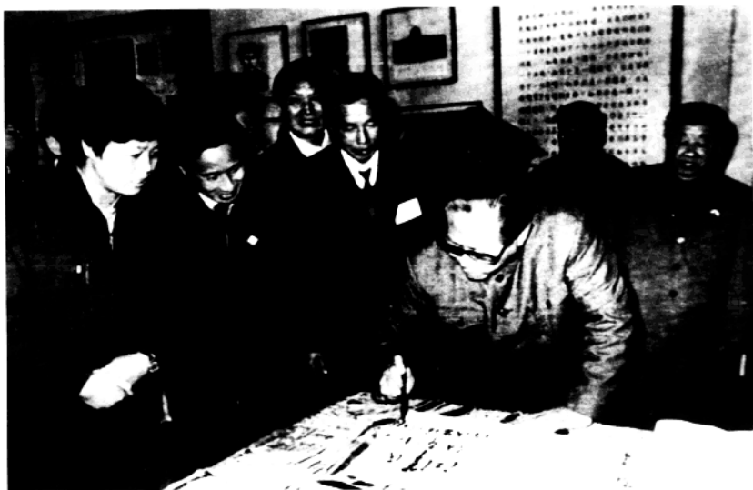
江泽民在湖南考察时参观长沙雷锋纪念馆时签名留念