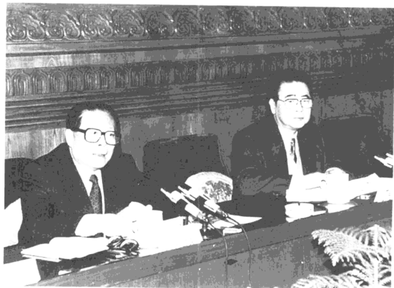
1994年12月23日，江泽民、李鹏与出席全国政法会议的代表座谈，并发表重要讲话