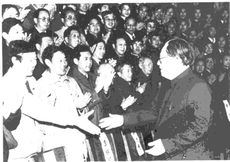
1989年11月28日，江泽民会见 全国省、市、自治区党报总编辑