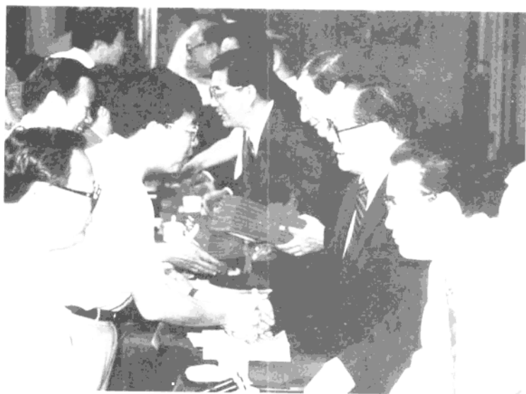
1995年6月30日，江泽民等中央领导 向百名优秀县(市)委书记颁发证书