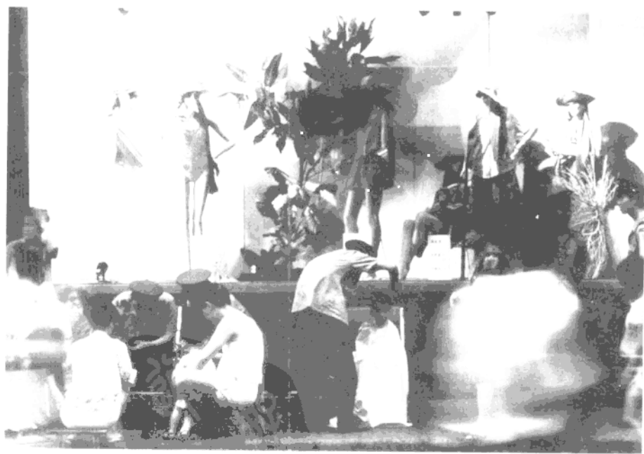
上海南京路上好八连战士与南京东路街道办事处共同成立了军民学雷锋小组。这是他们在开展便民服务活动