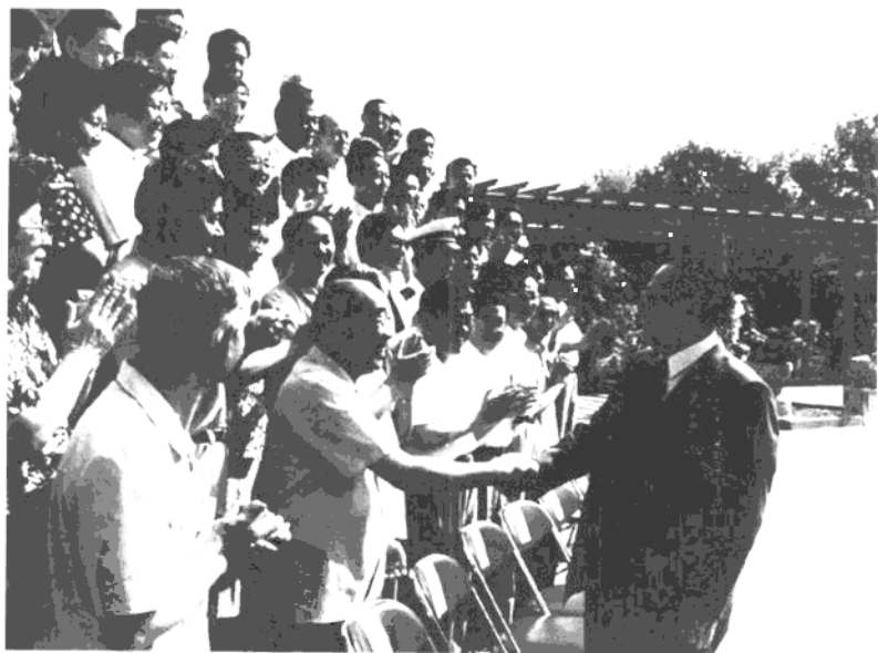
1993年6月25日，江泽民接见建党70周年座谈会代表