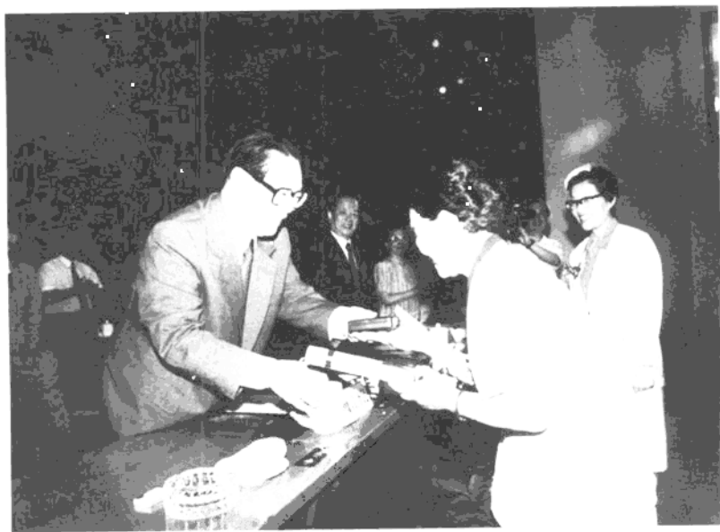
1995年6月29日，江泽民为南丁格尔奖章获得者颁奖