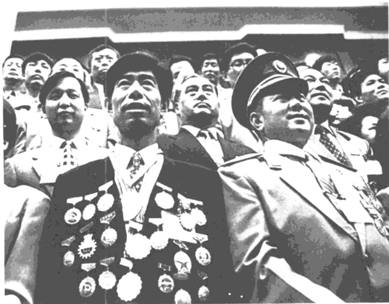
1997年4月29日下午，中国首次评选出的全国十杰工人和一些先进集体、先进个人，在北京人民大会堂接受共和国给予劳动者的最高荣誉和隆重表彰