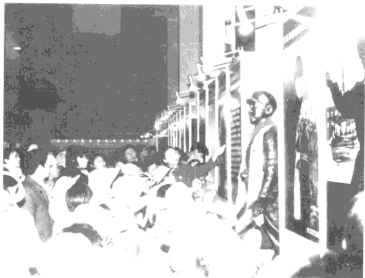
《雷锋精神永恒》展览于1988年2月27日在京开幕，人们踊跃参观