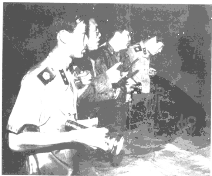
1994年7月13日至14日，辽宁省锦州市遭受30多年未遇到的特大洪峰袭击，中共锦州市委书记张鸣歧（右二）带领群众抗洪抢险，以身殉职。