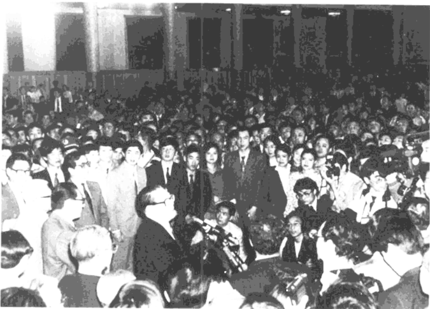
1992年5月4日，江泽民出席共青团纪念建团七十周年联欢会