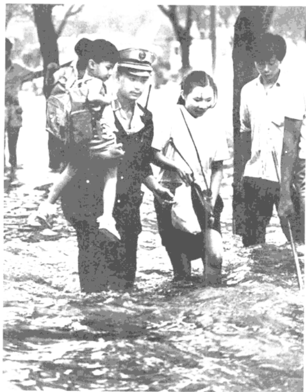
1990年9月10日，广州环市东路一条地下自来水管爆裂，广州交通民警在水中维持秩序，为民排忧解难