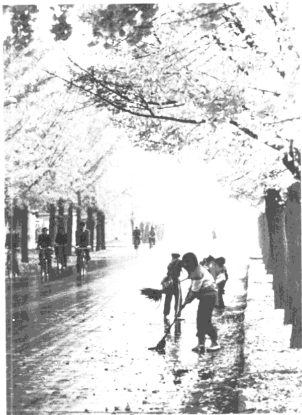
“五讲四美三热爱” 活动产生广泛影响。 这是北京小学生在朝 阳区街道清扫环境