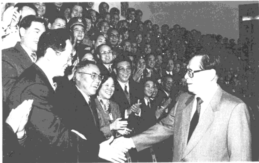
1997年11月22日，江泽民在人民大会堂会见出席全国组织工作会议代表