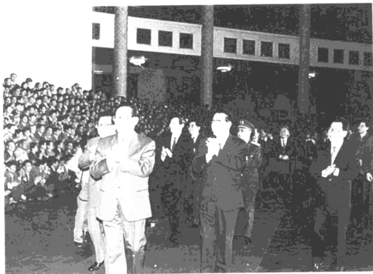
1995年4月29日，江泽民等接见全国劳模