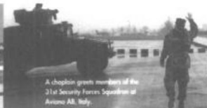
A chopper greets members of the 31st Security Forces Squadron at Aviano AB, Italy.