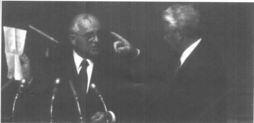
“8·19”之后大势已去的苏联总统戈尔巴乔夫和风头正健的俄罗斯总统叶利钦。