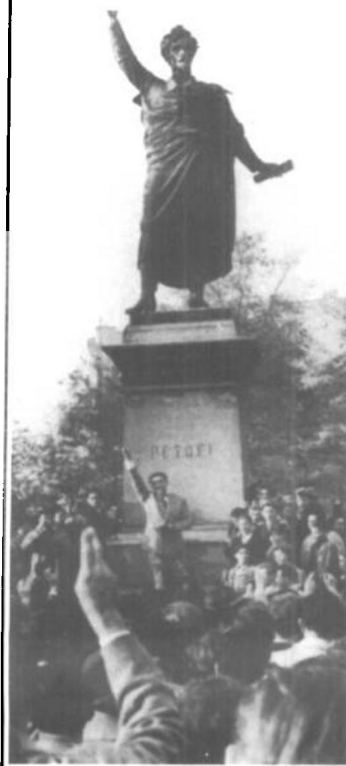
1956年10月，匈牙利爆发反政府的动乱。 左图和下图为动乱场景。