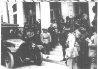
1919年凡尔塞条约签字。 左图为美国、意大利和德国代表到达会议地点。