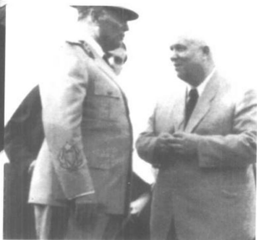
1955年5月，苏共中央总书记赫鲁晓夫访问南斯拉夫。图为赫鲁晓夫与铁托会面情景。