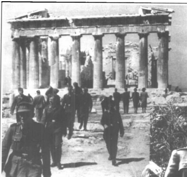
1941年，德国人入侵希腊。图为游览雅典古迹的德军士兵。