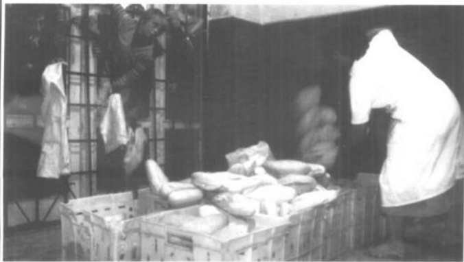
动乱中的阿尔巴尼亚，面包成为紧俏品。