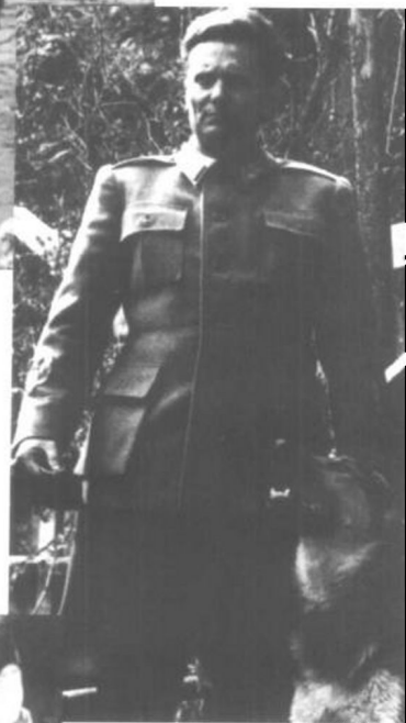
1941年，南斯拉夫共产党游击队统帅铁托在他的山间隐蔽所。