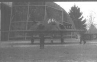
对南联盟实施空袭的美国及北约的空中力量。