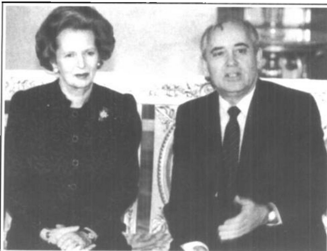
为推行“新思维”寻求西方支持，苏共中央总书记戈尔巴乔夫开展微笑外交。图为戈氏与英国首相撒切尔夫夫人。