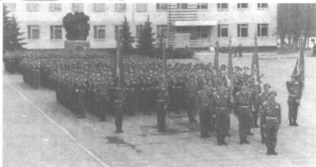
先期占领普里什蒂那国际机场的俄罗斯空降部队。