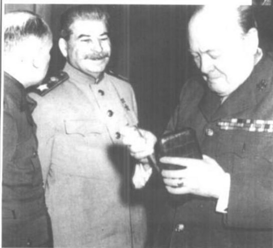
1945年2月雅尔塔会议上的丘吉尔和斯大林。