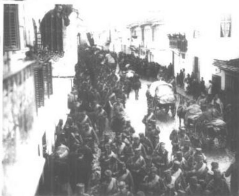
第一次世界大战中的塞尔维亚城市。