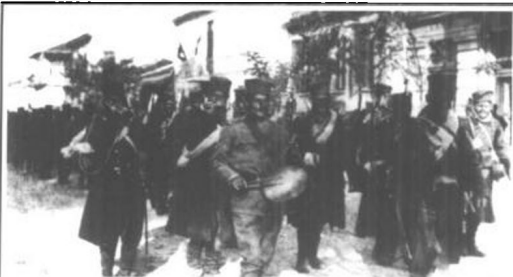
1914年底，塞尔维亚军队正开赴前线。