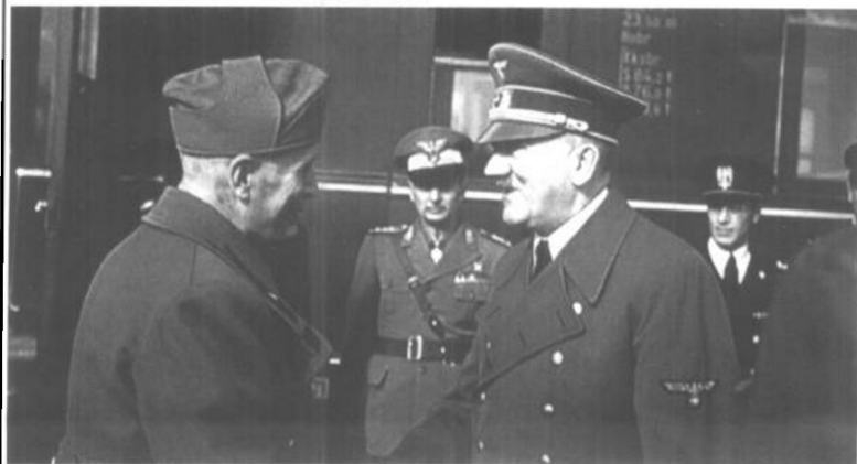
1940年3月，墨索里尼和希特勒在柏林会晤，共同协商在欧洲战场特别是巴尔干地区的行动。