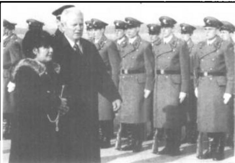
南联盟总统米洛舍维奇与夫人一起视察部队。