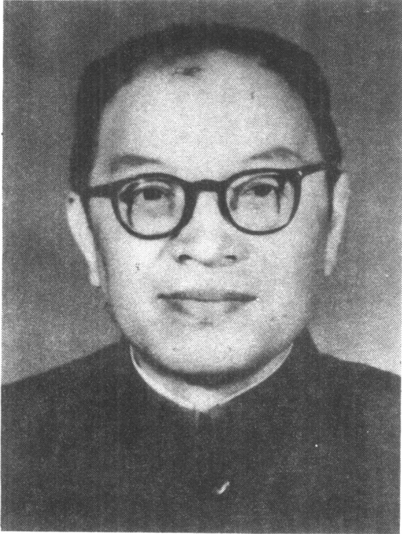
张 闻 天