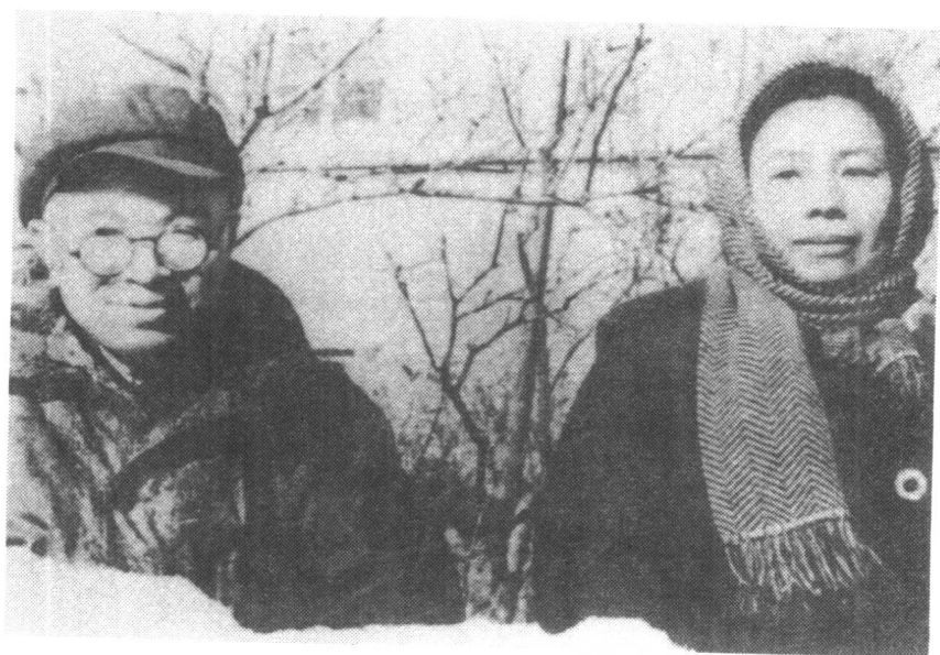
张闻天同夫人刘英在佳木斯(1947年)。