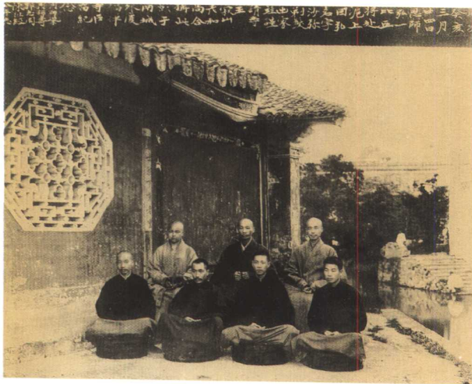
與寂山、因弘和尚 一九二二年攝於溫州