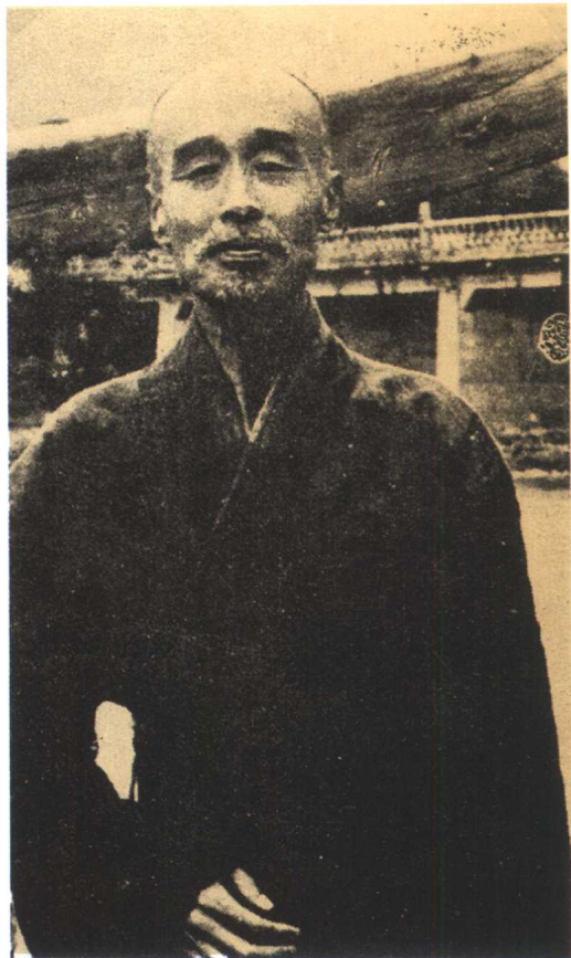
一九四一年攝於晉江檀林鄉，大師名著 《律鈔宗要隨講別錄》完成於是處。