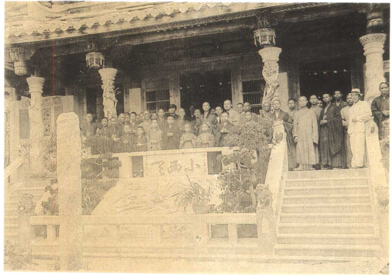
一九三七年攝於廈門萬石巖