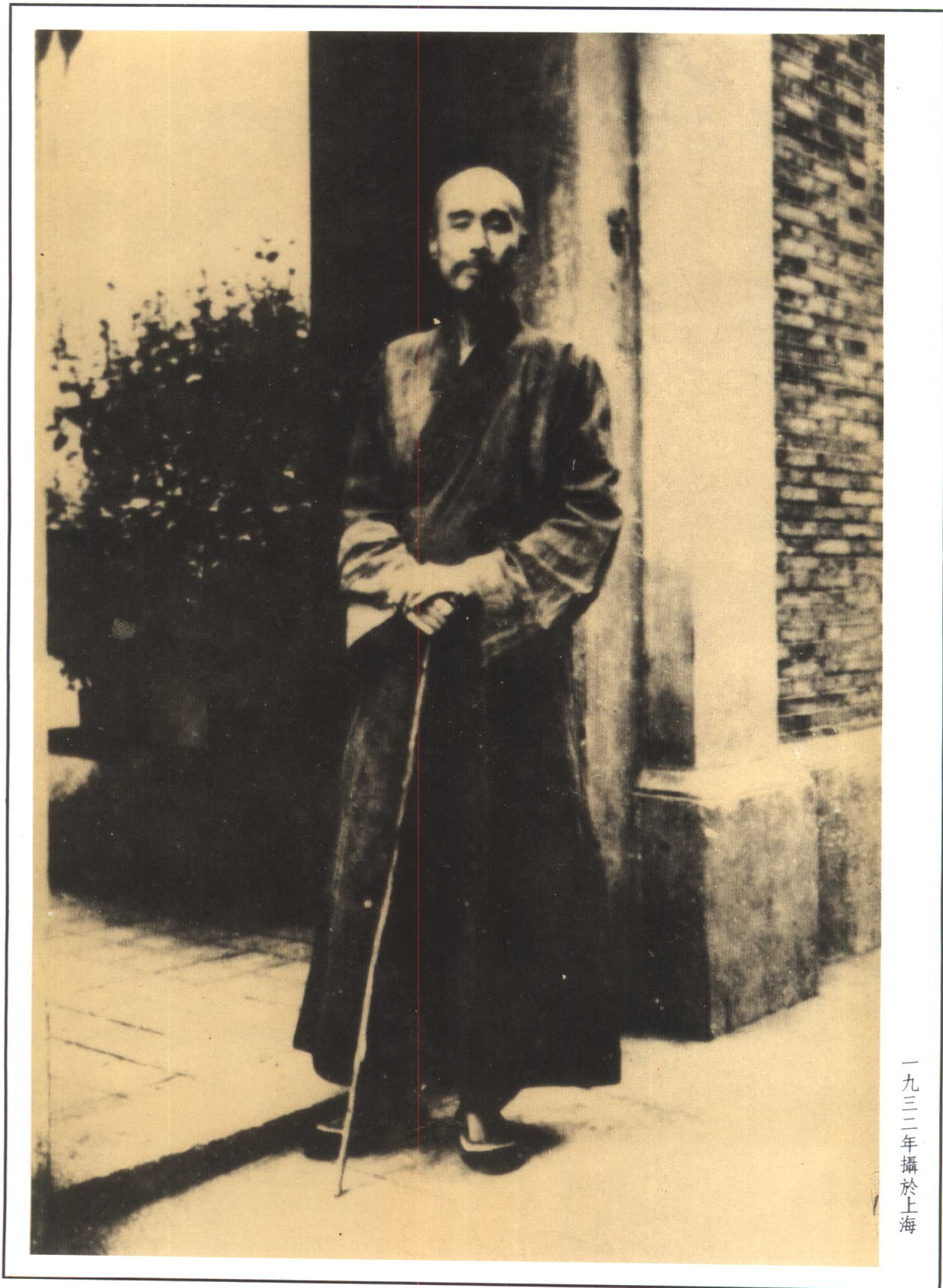
一九三二年攝於上海