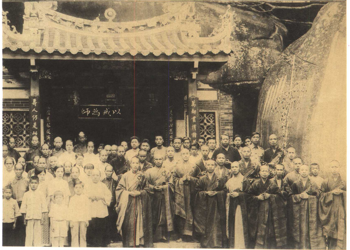
一九三三年攝於廈門萬壽巖