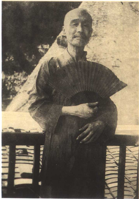
一九三六年夏攝於廈門日光巖