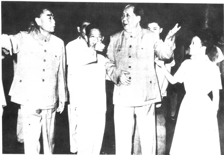
一九六四年由胡耀邦陪同出席共青团“九大”开幕式。