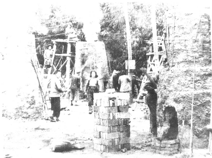
成都土法炼钢的“高炉”。