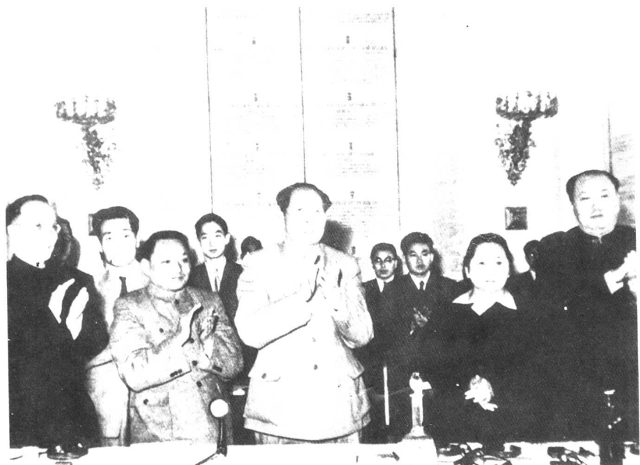
一九五七年在莫斯科。