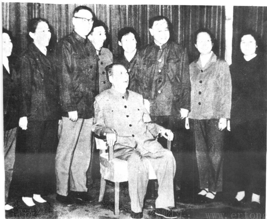
一九七五年十月与医护人员合影。