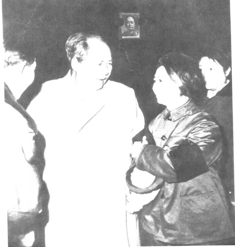
右 参加陈毅追悼会，高度评价老干部。 下 一九七〇年与斯诺夫妇在天安门城楼。