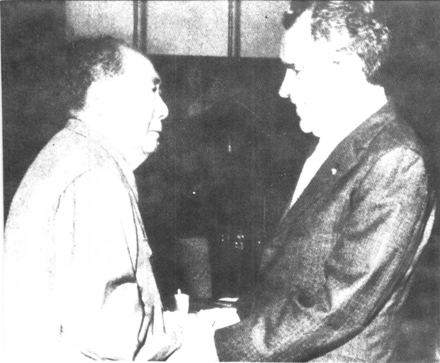
一九七二年二月会见美国总统尼克松。