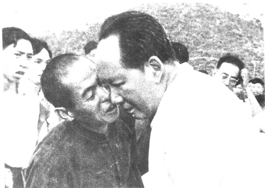
一九五九年倾听乡亲诉说。