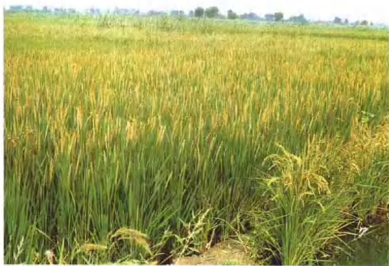
暗管排咸一小站 稻长势喜人