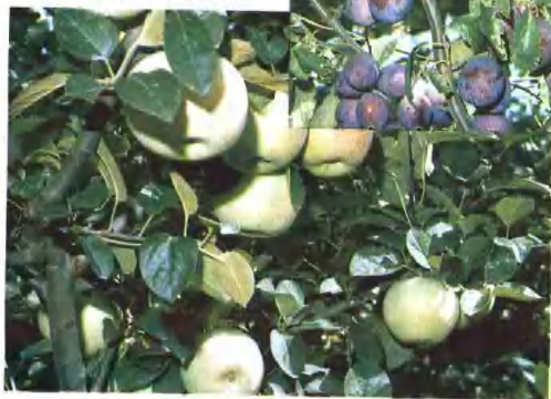
暗管排咸—苹果喜获丰收