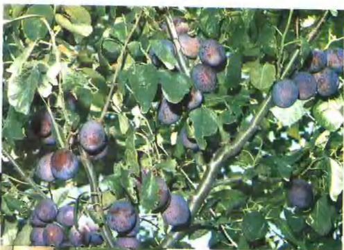
引进国外品种—李子