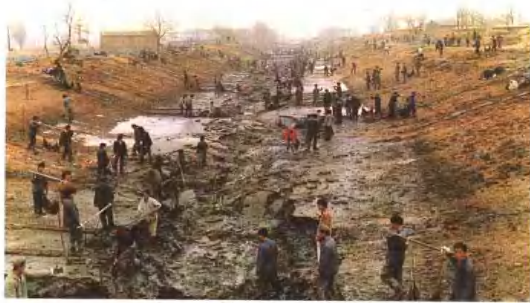
二级河道人工清淤