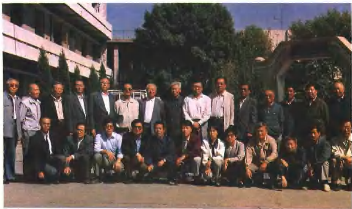
《津南区水利志初稿》评审会合影