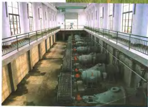
十米河扬水站机房内景