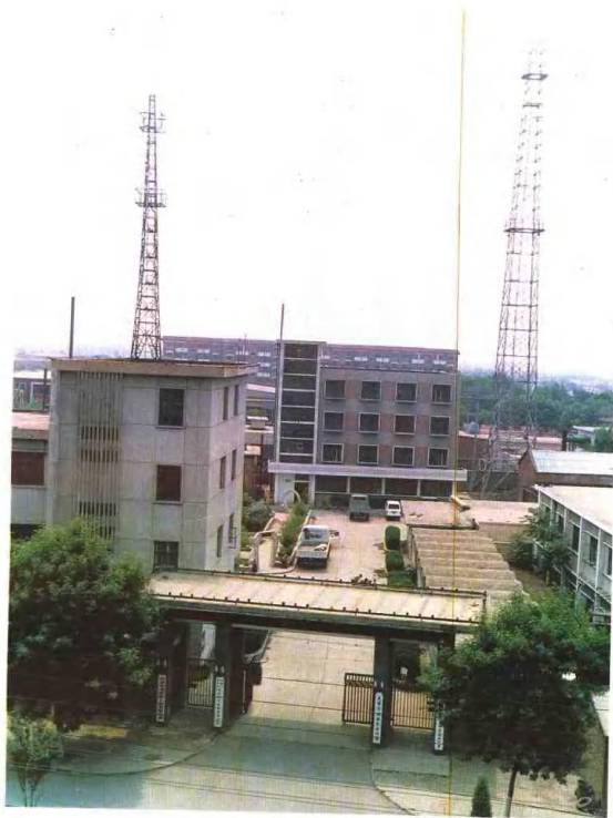
津南区水利局乌瞰