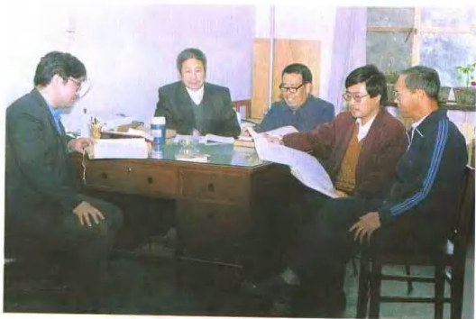
编撰人员对初稿进行研讨