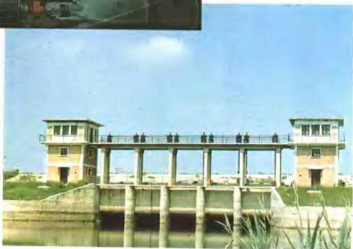
洪泥河首闸(七十立方米每秒)