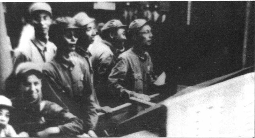
1949年解放军入城式军管会文艺处彩车，车上有夏衍、于伶