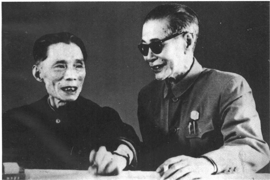
1979年文革后，夏衍、于伶第一次重逢