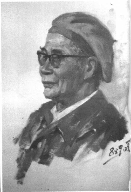
1983年于伶油画肖像（作者刘宇一）