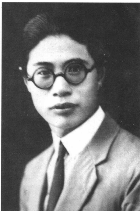
1928年12月任教于南京“省女子师范实验小学”