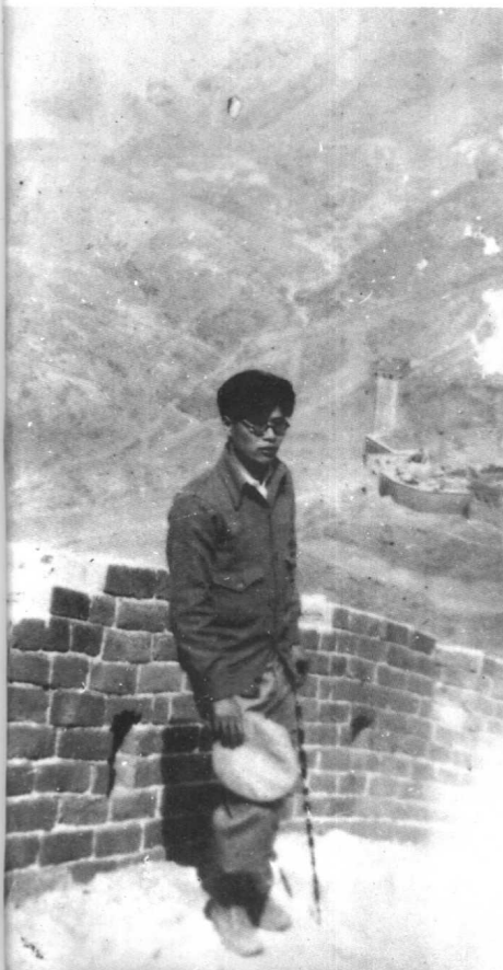
1931年清明就读于“北平大学” 法学院俄文系