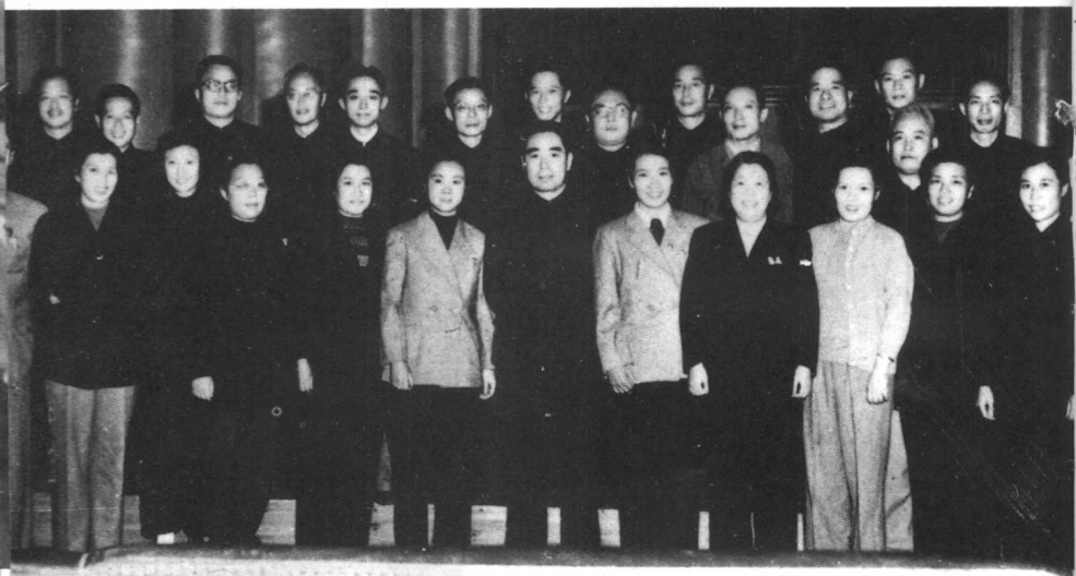
1954年周总理会见我国第一部彩色故事片《梁祝》全体工作人员，在座有于伶、夏衍、袁雪芬、范瑞娟等。