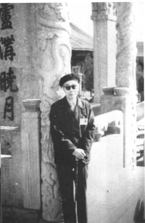
1991年全国政协会议期间 摄于卢沟桥（钱筱章摄）