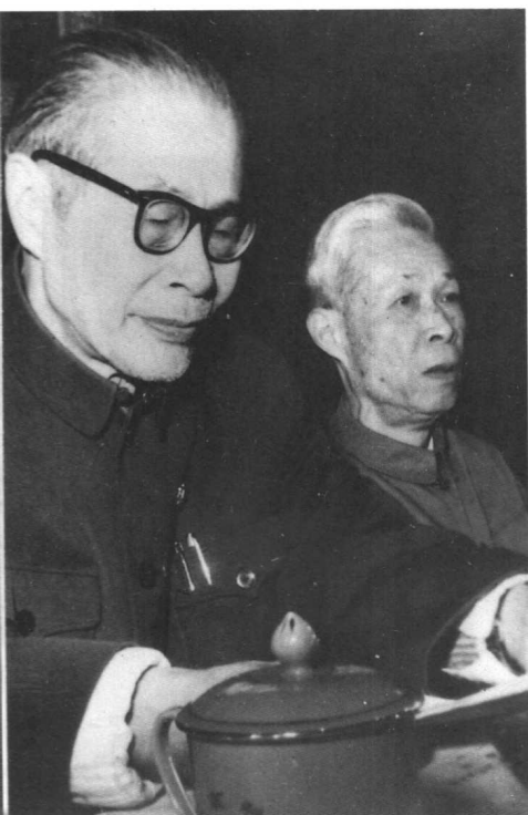
1981年第四次全国影代会、主持会议