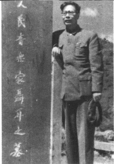
1962年云南昆明疗养时，在聂耳纪念碑前