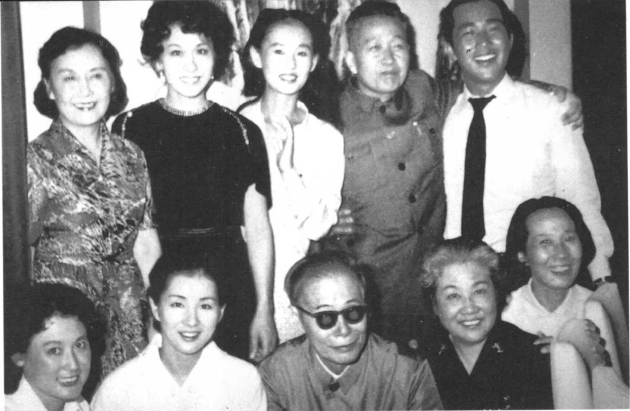
中日两国电影工作者联欢