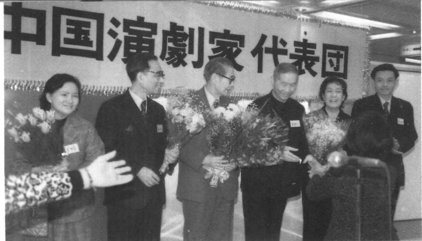
1979年中国戏剧家代表团访问日本