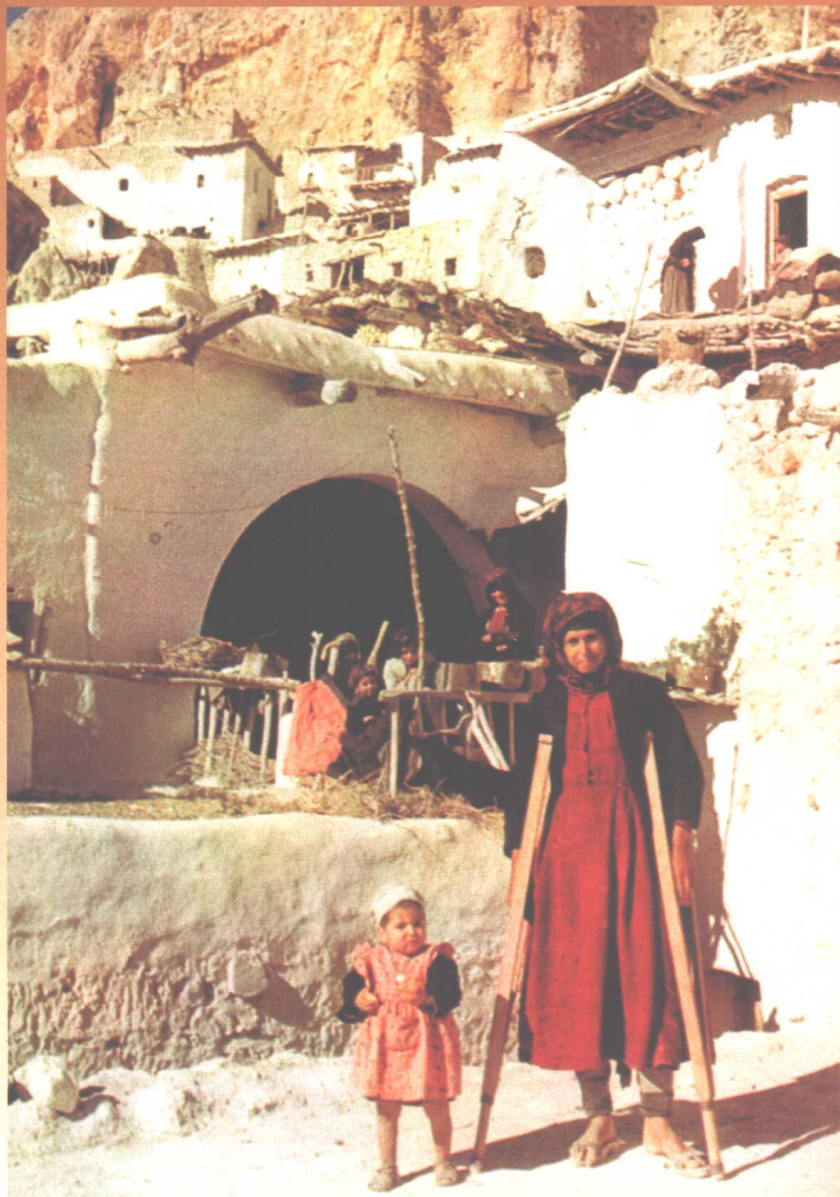
犹太人居住地，耶稣也许是在这样的环境中长大的。