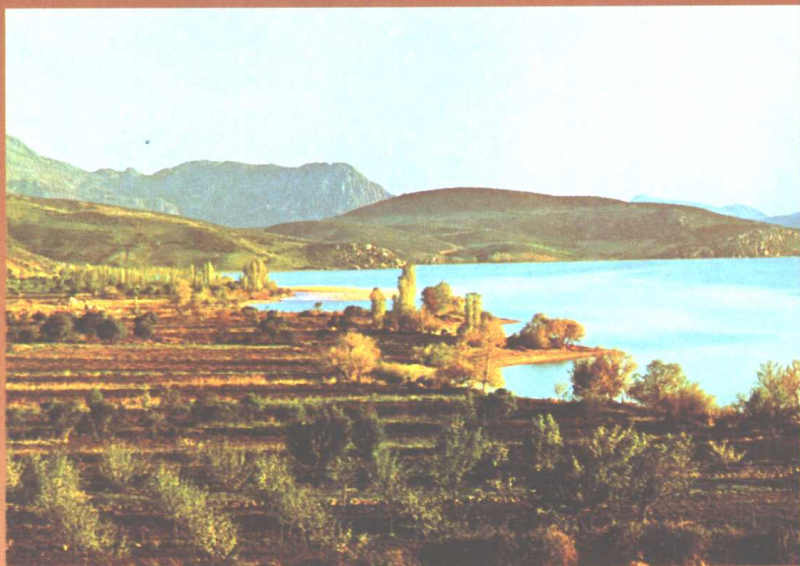
丕息狄雅的安提约基亚(Antiochia of Pisidia);圣保禄宗徒曾在此传过教。今属土耳其。