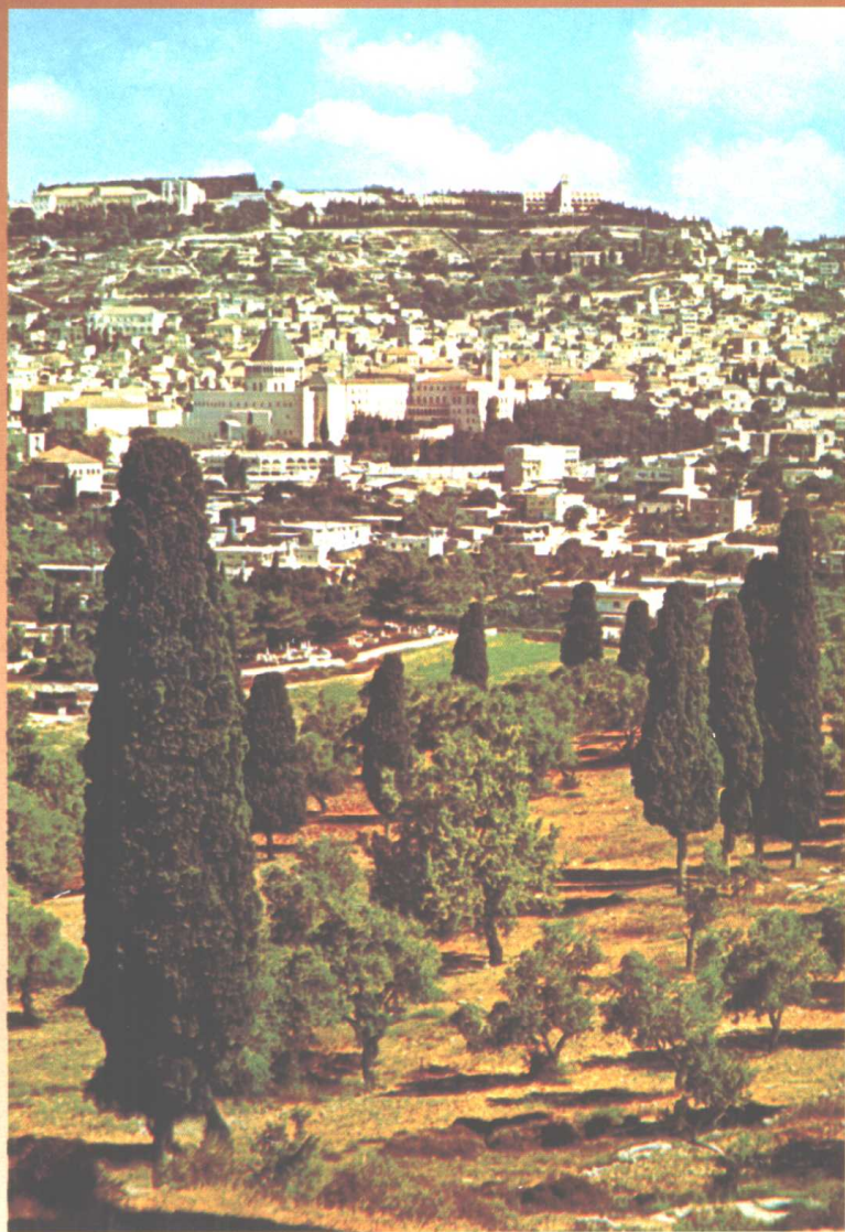
今日的拿撒勒，耶稣童年时的居住地。