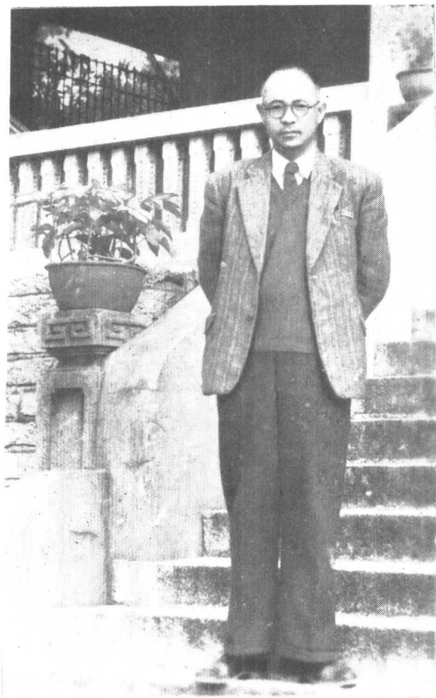
1954年王亚南撰写《中国地主经济 封建制度论纲》时的照片