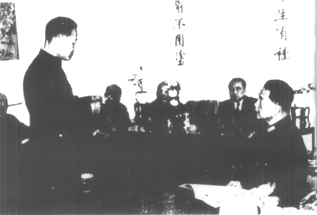
李士群向汪精卫汇报工作