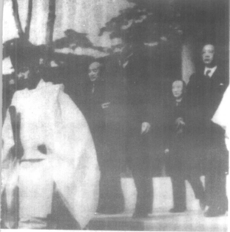
汪精卫、李士群同日本首相东条英机合影