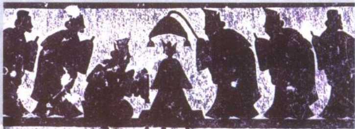
周公辅成王画像石

夏启建制，废公立私。天下为家，王位世袭。 商王成汤，求贤用士。革命反正，拨乱兴治。 纣王无道，多行不义。酒池肉林，骄奢淫逸。 怙恶不悛，声名狼藉。恶贯满盈，众叛亲离。 文王兴周，鸣琴而治。政简刑清，有凤来仪。 拘而演易，太极两仪。变化无穷，天人合一。 吉凶祸福，昼乾夕惕。天行其健，自强不息。 太公钓鱼，相机待时。老而弥坚，择主而事。 飞熊入梦，左辅右弼。明君贤相，匡国济时。 武王伐纣，仁义之师。吊民伐罪，发扬蹈厉。 牧野之战，反戈一击。归马放牛，与民休息。 文武之道，一张一弛。礼乐刑政，宽猛相济。 周公吐哺，宵衣旰食。天下归心，沐仁浴义。