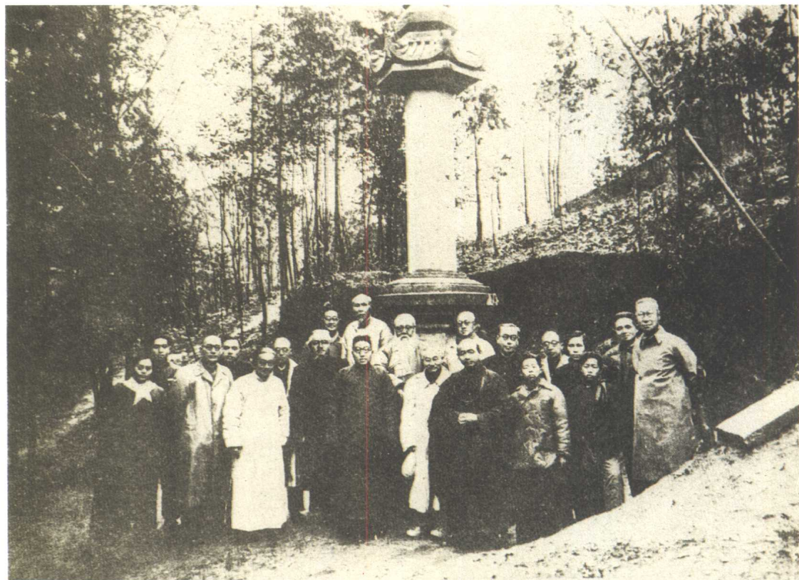
一九五四年攝於杭州