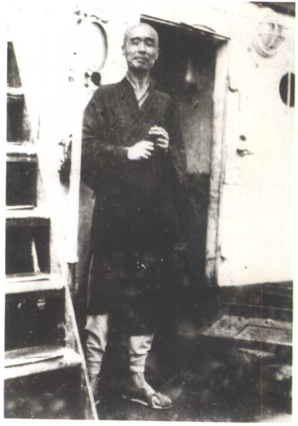
一九三七年赴青島講律，由廈門出發時攝於「太原輪」。