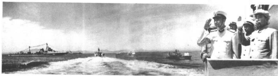
1957年8月，周恩来代表中共中央和毛泽东检阅海军北海舰队时，和海军司令员萧劲光大将在军舰上。