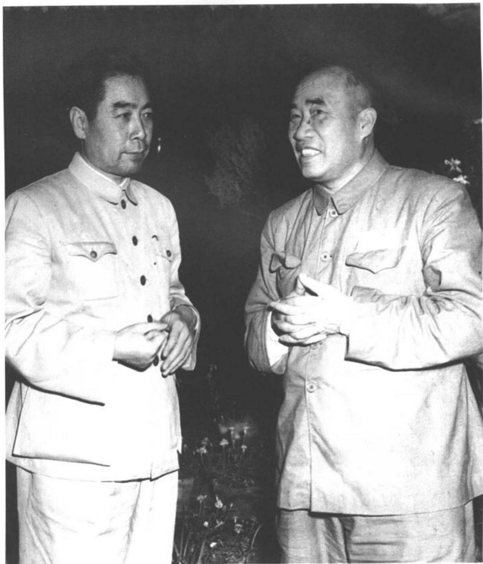
1950年6月，周恩来和朱德总司令在全国政协会议休息时交谈。