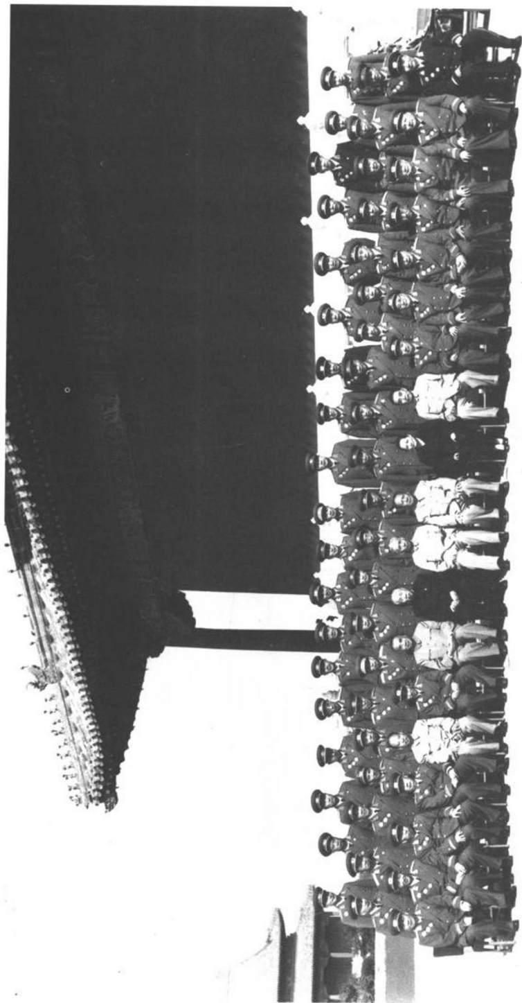
1959年10月1日，周恩来和毛泽东、刘少奇、朱德、宋庆龄等同中国人民解放军元帅、将军们在天安门城楼上合影。