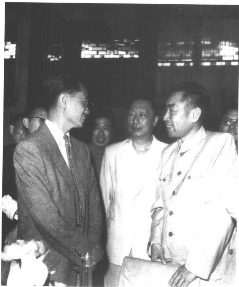
1956年在制订全国科技发展远景规划时，周恩来同聂荣臻和归国留学生在一起。