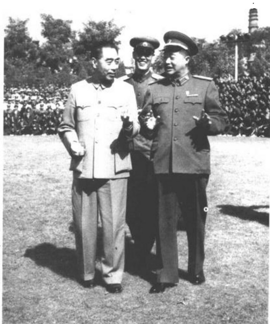
1959年10月，周恩来和贺龙元帅接见参加国庆十周年大典阅兵式的解放军各军兵种代表。