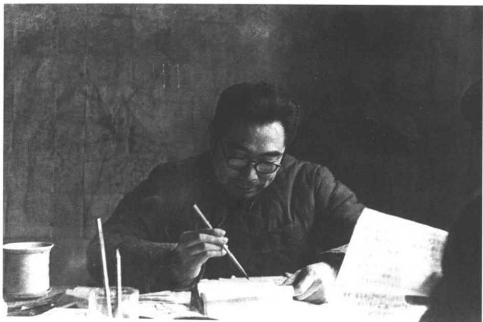
1948年4月，在河北建屏县西柏坡协助毛泽东指挥辽沈、淮海、平津三大战役时的周恩来。