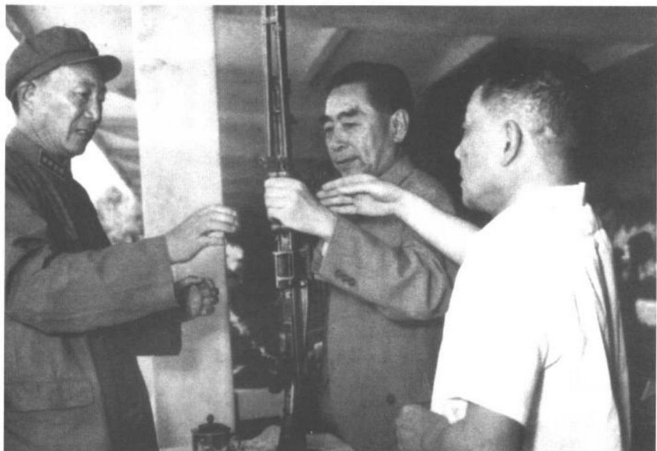
1964年6月，周恩来和邓小平、罗瑞卿大将观看军事表演时，看国产轻机枪。