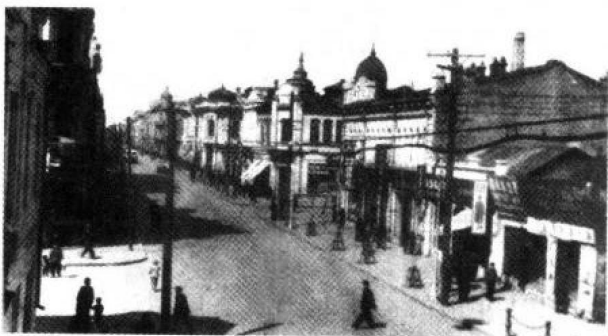
中华名街系列丛书