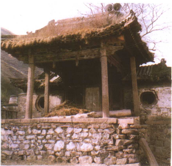
上: 清代建筑—青龙 三义口戏台 下: 民国时期建筑