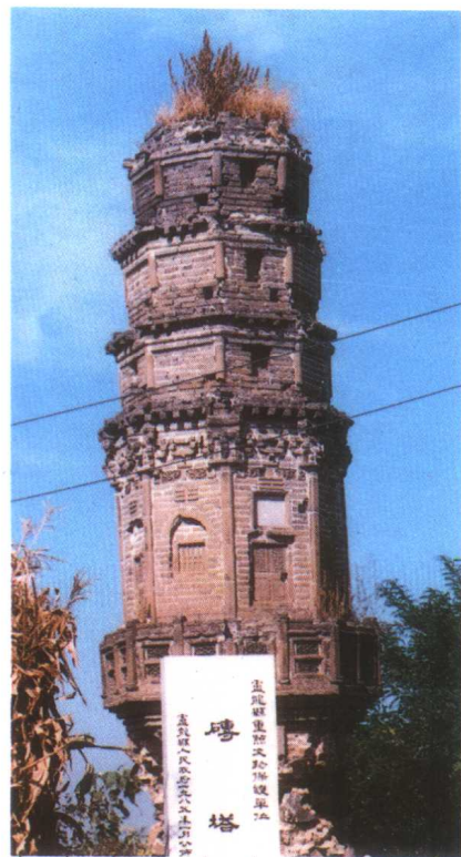
上左: 明代建筑—万里长城 上右: 清代建筑—砖塔