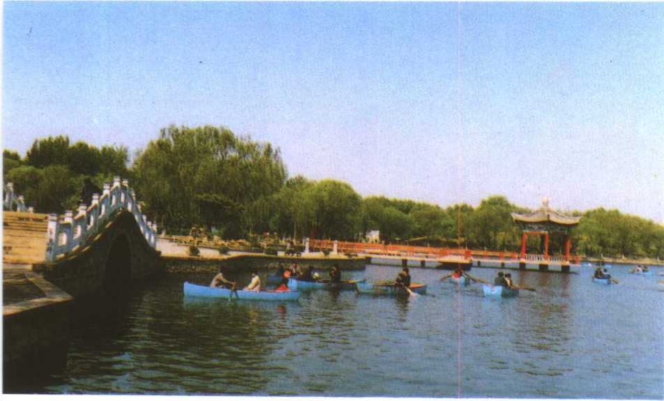
上: 海港区人民公园 中: 北戴河区街心花园 下: 山海关区护城河花园