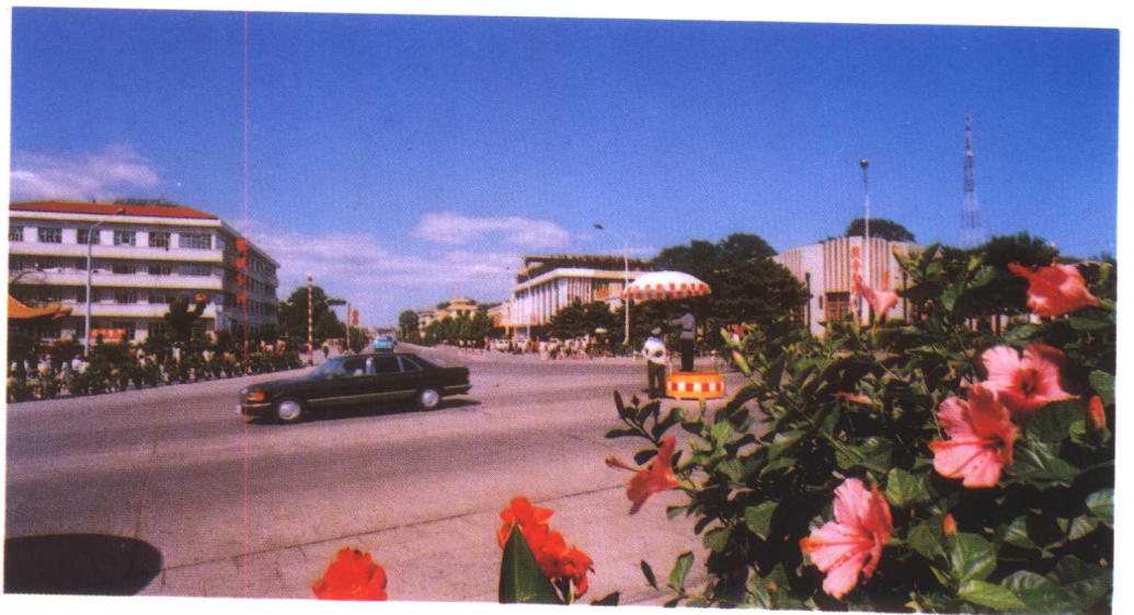
上: 秦皇岛市商业区 中: 秦皇岛市经济技术开发区 下: 北戴河海滨旅游区