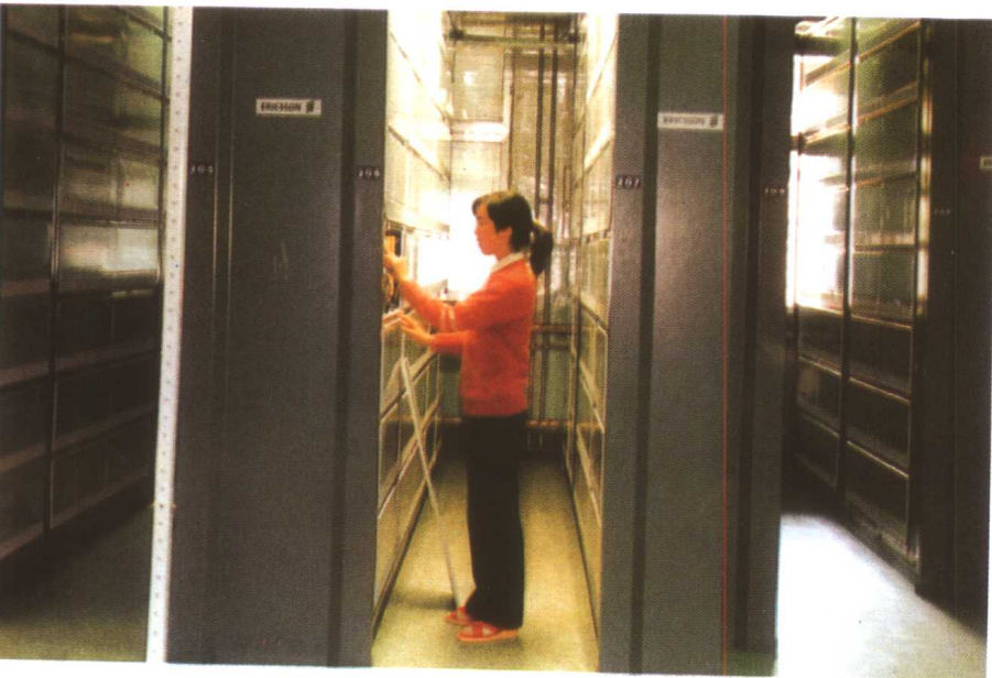
上右: 特大公路桥 上左: 205 国道 中: 秦皇岛输油公司 下: 万门程控电话