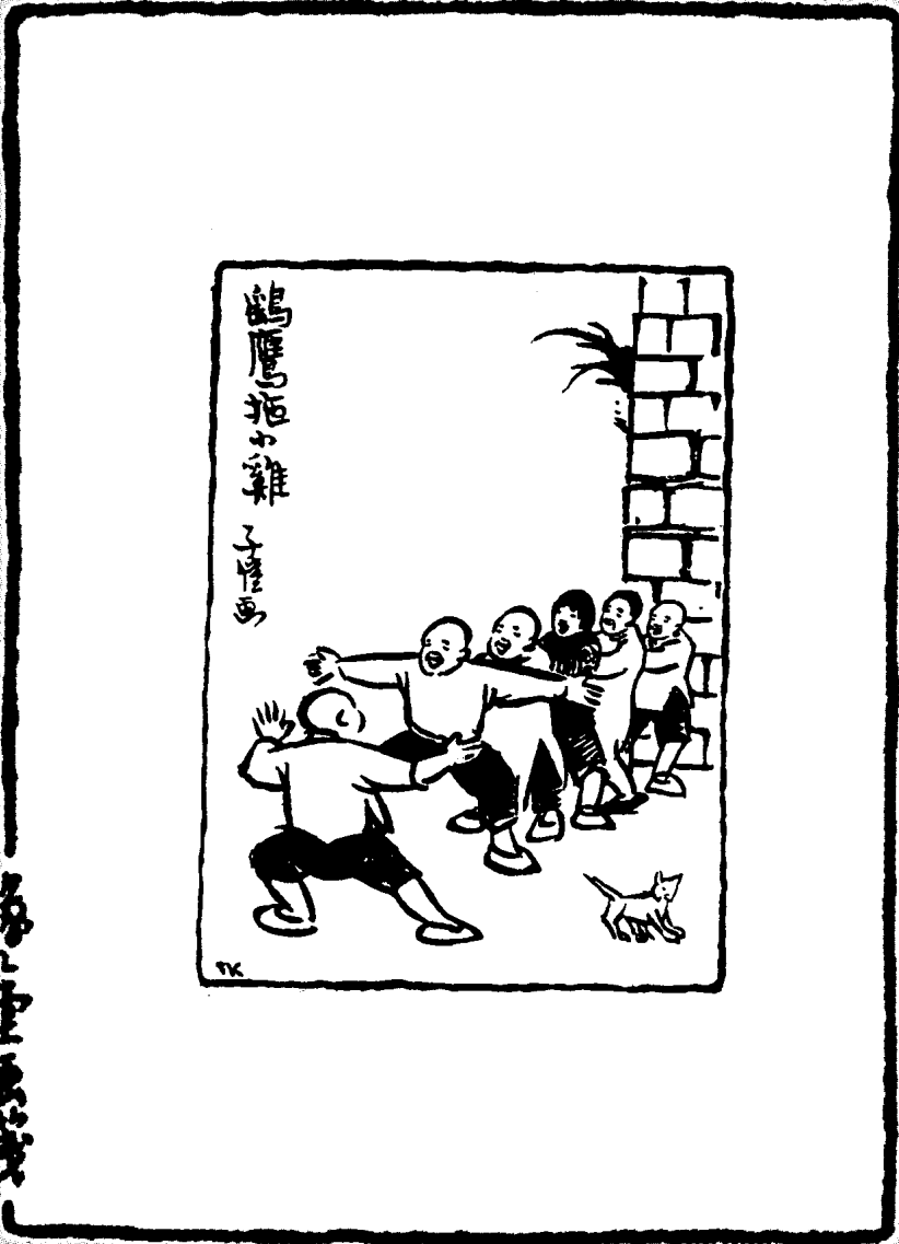
原收入《幼幼画集》（上海儿童书局 1947年7月初版）。