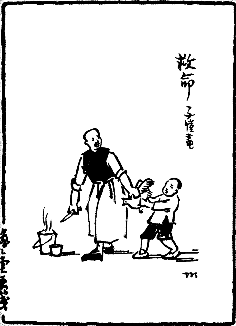
原收入《幼幼画集》(上海儿童书局 1947年7月初版)。