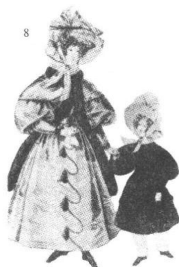
1829年。穿着罗曼蒂克式服装的妇女与少女。

从第一帝国开始迎来了王政复古的法国,自然的高腰身式的复活,宽大的袖子,圆圆地膨起的裙子,幻想性的罗曼蒂克式诞生了。1830~1940年代,幼儿服的裙子很大,从变短的裙子可以看到苗条可爱的裤子(照片8)。