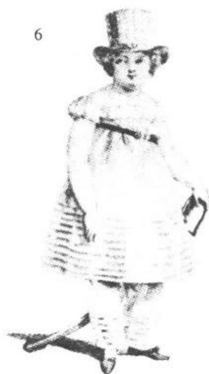
6、1816年。高腰身的连衣裙下配穿着裤子的男童。《西洋服装史》

子们从无条件的服从中解放出来,满是装饰的服装逐渐消灭。这种行动,少女服先一步发展。