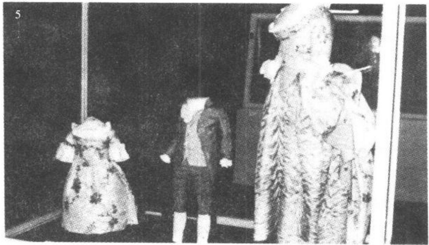
5 左右是罗布·安·拉·弗朗仙斯(左是女童服),中间是阿比·安·拉·弗朗仙斯(男童的服装)。伦敦博物馆藏。

18世纪是法国政治、经济、文化大开发时代。在流行方面也担负着对全欧洲的指导性责任。当时的女子服装,罗布·安·拉·弗朗仙斯是用紧身胸衣紧裹身体,用裙撑撑起使裙子有膨胀的特征,而构成形体华丽的服装。男装阿比·安·拉·弗朗仙斯,是代替紧身上衣登场的优雅的男子服装。把这些衣服做小些,就成了上层阶级的男、女童装。照片5展示出了18世纪女子服装和男童装,女童装。这明确地表示出童装是成人服装的小型化。这个时期,一位启蒙思想家卢梭(1712年~1778年,写的《爱弥尔》(《Emile》))一书是理想的教育论。在这本书中,对于让儿童穿着窄