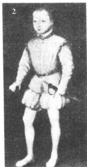
1563年亨利4世的儿童时代回顾展。《西洋服装史》(文化出版局刊)