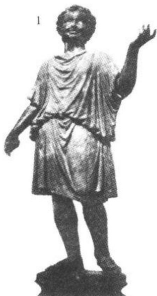
希腊时代,穿希顿的少年像。东京都美术馆藏

15、16世纪的文艺复兴时期以后的衣服,明确地表现出了男性、女性的体形特征。肩上