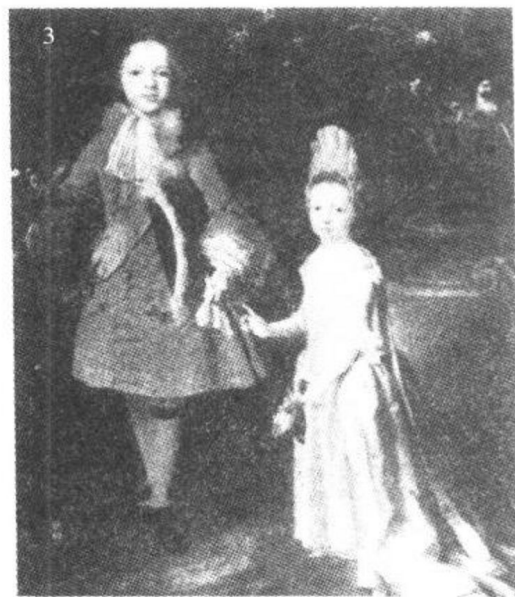
1695年詹姆斯·斯特奥特和他的妹妹。《西洋服装史》(文化出版局刊)