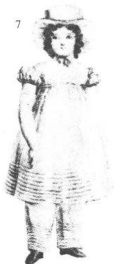
7、1817年。高腰身的连衣裙下配穿着裤子的女童。《西洋服装史》(文化出版局刊)