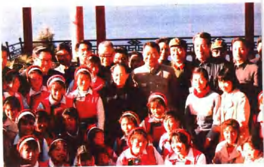
胡耀邦总书记视察大理和白族青年在一起