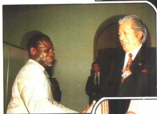
拜会联合国人类居住 环境会议事务总长恩达乌