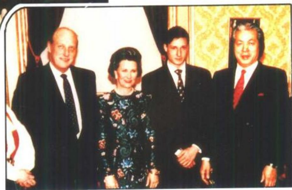
挪威国王接见福永法源