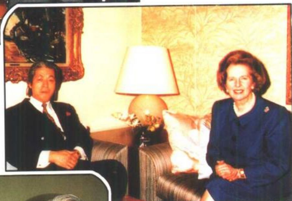
和英国首相撒切尔 夫人在一起 (1991年)