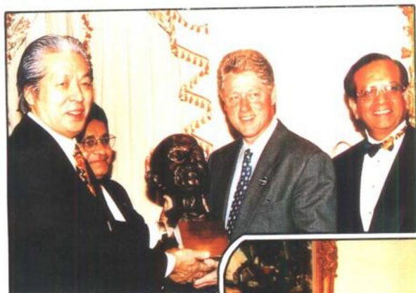
向美国总统克林顿 颁发甘地荣誉奖 (1996年)