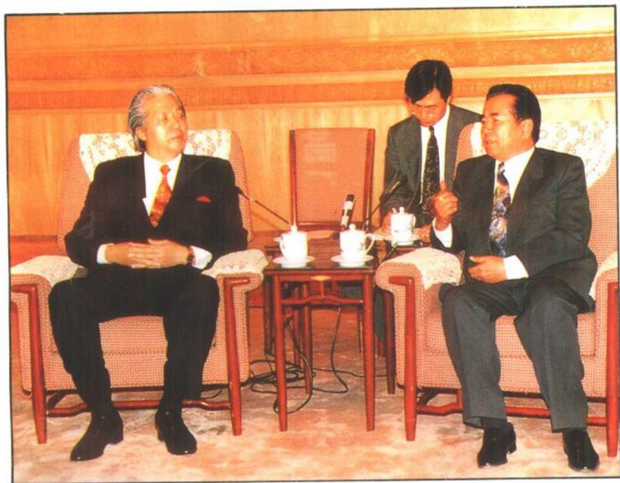
全国人大副委员长铁木尔·达瓦买提在北京人民大会堂会见福永法源（1996年5月29日）