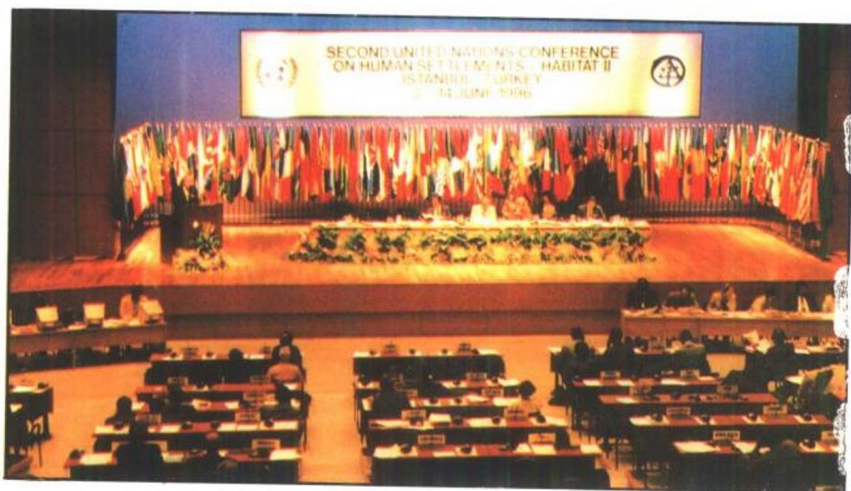
在联合国人类居住环境会议上讲演 (1996年)