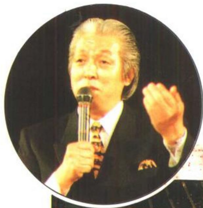
在日本东京“天声开说讲演会”上讲演