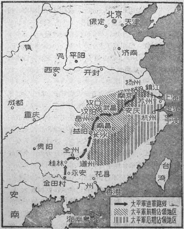
图二、太平天国革命形势略图