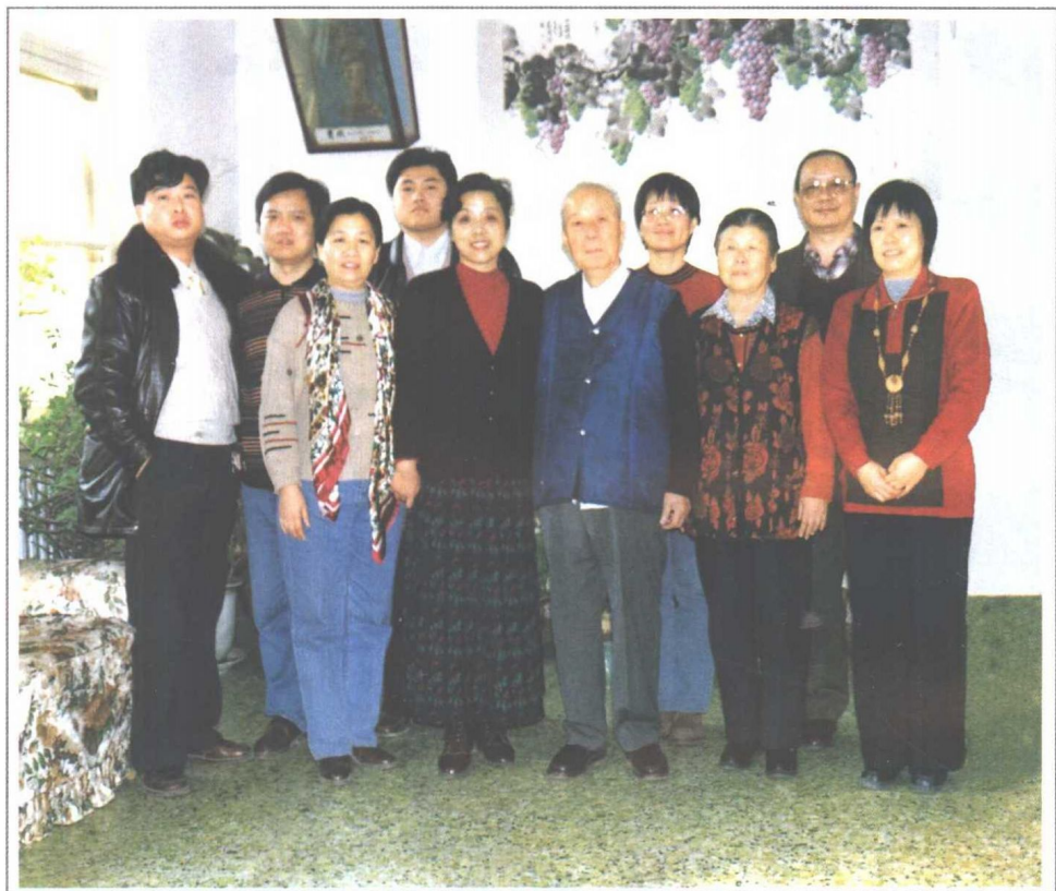
莫文骅将军夫妇与语丝文化工作室、 当代世界出版社等有关工作人员合影