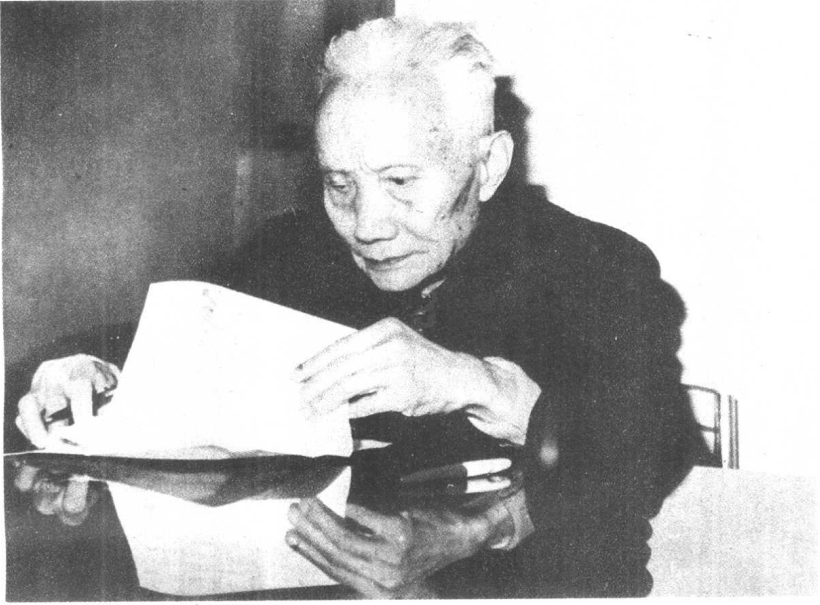
美学老人壮心不已 治学不倦