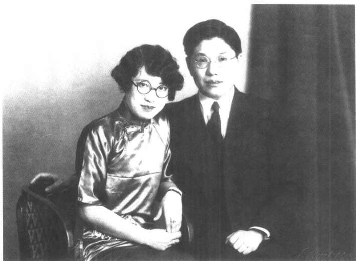
冯至与姚可崑在海德堡订婚时合影(1933年6月6日)