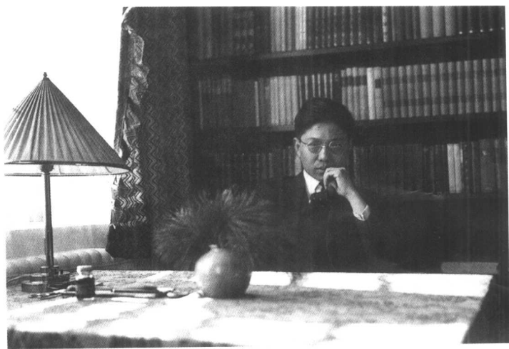
冯至在柏林郊区爱西卡卜住所(1932年)