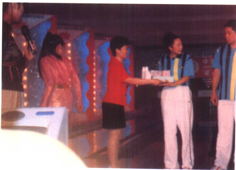
在中央电视台“欢聚一堂”节目梅晓芳校长为著名歌手孙悦颁发芳馨中草药专业护肤系列产品