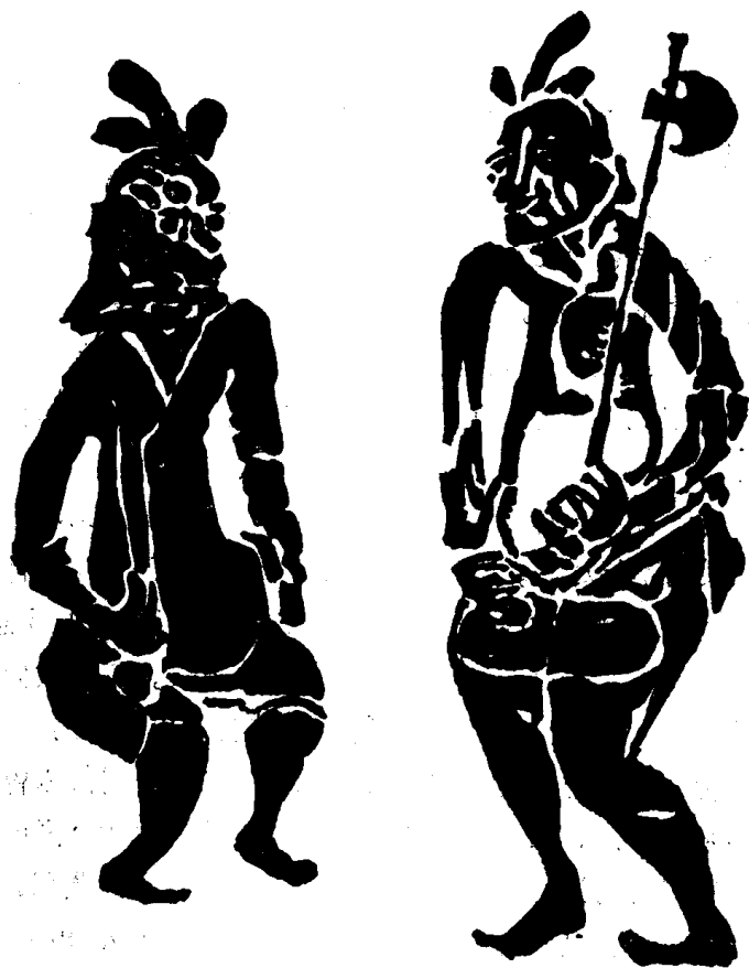
古老的门神：神荼、郁垒 (汉代画像，现存河南南阳)

迟恭、文天祥、戚继光、赵云、岳飞，或神荼、郁垒。……神以及关于神的传说，这么深地渗透进了我们的生活，以致成为各种风俗的基础。